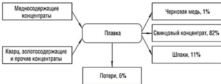
Рисунок 2 – Распределение кадмия при переработке медного сырья (на примере ОАО «СУМЗ», 2014 г.)

В частности, в медеплавильное производство ОАО «Сред-