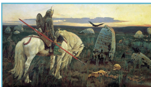
В.М.Васнецов «Витязь на распутье»

Вопрос выбора жизненного пути русским богатырём на холсте «Витязь на распутье» таит в себе роковой смысл. В каждом предписанном выборе таится манящая приманка-западня. «Правильный» выбор приманки – главное условие удачи каждой западни. Точно так же, как русский витязь на картине, и русский народ оказался на распутье в своём историческом развитии. Времени на раздумье не так уж и много. Мрачный фон картины как бы символизирует нависшую над всем человечеством угрозу самоуничтожения, хотя большинство людей этой угрозы не ощущают. Что люди видят на заднем плане картины? Закат, это на картине, или рассвет? Для кого как! Люди, ощущающие рассвет, выбирают духовный путь развития. Люди, предполагающие, что это закат, выбирают антидуховный путь развития. Остальные следуют предписанному 3 выбору.