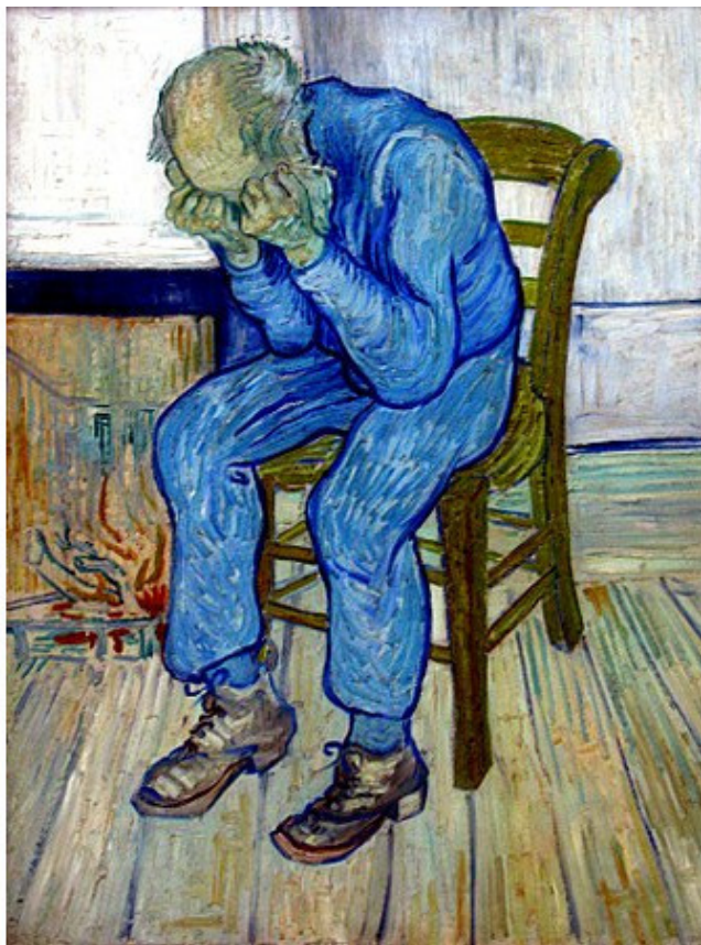
«На пороге вечности», Винсент ван Гог