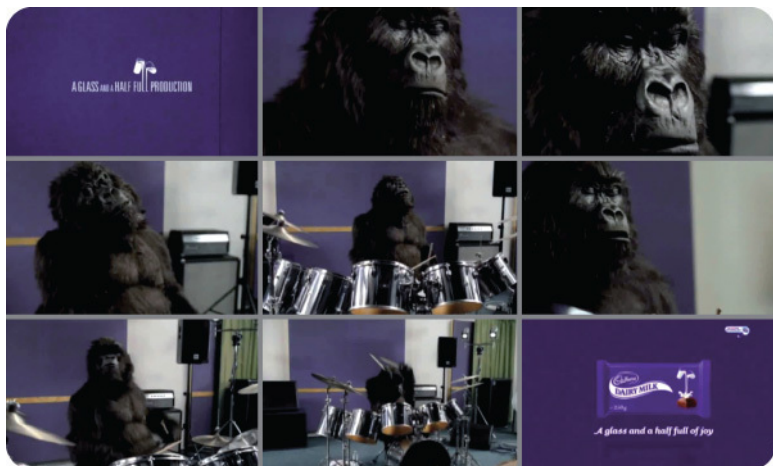
Рис. 1.1. Нашумевший ролик «Горилла» бренда Cadbury

паниии возникли проблемы с качеством продукта. Поэтому целью Cadbury было вновь завоевать «умы и сердца» британцев, а идеей рекламного агентства – «заново открыть радость от продукта». В упомянутом рекламном ролике персонаж, обезьяна-горилла, вначале прислушивается к музыке, а затем барабанит в такт песне Фила Коллинза In the Air Tonight. К рекламе проявили огромный интерес не только покупатели, но и те, кто работает в сфере бренд-менеджмента. Она была очень необычной для своей категории, поскольку главная роль в ней принадлежала не шоколаду, а горилле. В ролике (см. рис. 1.1) не было кадров потребления продукта, только в самом конце показывалась упаковка шоколада.