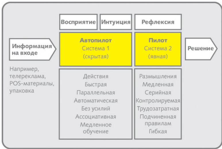
Рис. 1.3. Лауреат Нобелевской премии Дэниел Канеман выяснил, что наши решения и поступки определяются взаимодействием двух систем

В основе модели Канемана лежат две различные системы мышления и принятия решений, которые движут нашим поведением и выбором. Он называет их система 1 и система 2. Система 1 интегрирует восприятие и интуицию. По словам Канемана, она всегда активна, «никогда не спит». Она очень быстрая, обрабатывает всю входящую информацию параллельными потоками, без усилий, на основе ассоциаций, а еще «медленно учится», то есть медленно усваивает и меняет присущие ей автоматизмы. Эта система предназначена