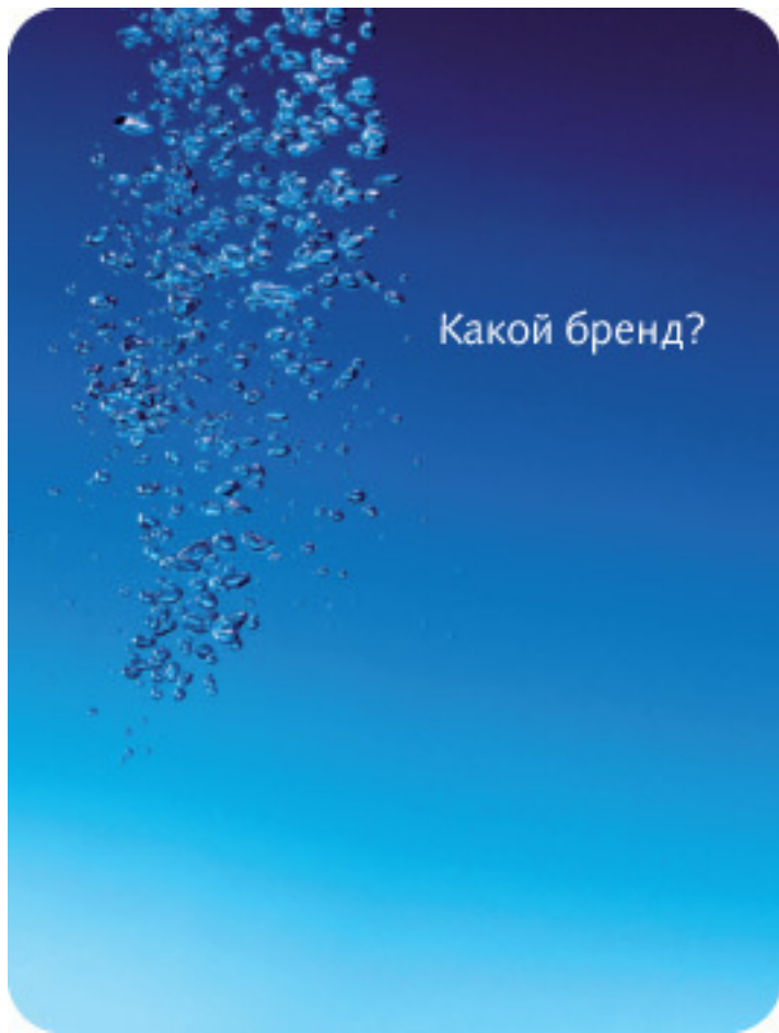
Рис. 1.2. Бренд не назван, но мы его узнали

Вам не понадобился логотип, чтобы сразу сказать, что