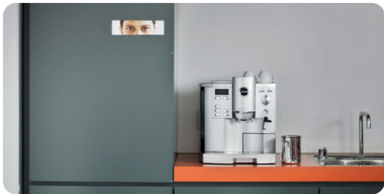
Рис. 1.5. Автопилот обрабатывает получаемую из окружающей среды информацию, даже если осознанно мы не обращаем на это внимания

В каждом офисе есть небольшая кухонька, где рядом с чайником обычно стоит коробка, куда сотрудники кладут деньги на восполнение затрат на чай, кофе, сахар и молоко. Это так называемая коробка честности. Обычно сотрудники возмещают компании не столько денег, сколько она затрачивает на покупку для них чая, кофе и молока. В ходе одного эксперимента на стену возле «коробки честности» повесили вырезанные из журнала глаза (см. рис. 1.5), в результате чего люди стали класть туда больше денег.