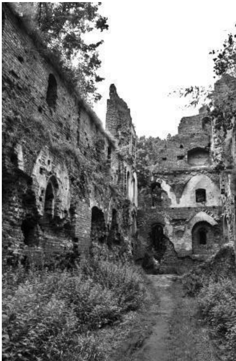
Развалины замка Бальга.

На территории комплекса в послевоенные годы велись активные поиски Янтарной комнаты, что включало в себя бурение и добавило разрушений. Рядом находится небольшой немецкий мемориал-кладбище.