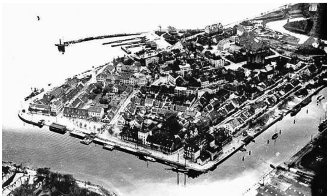
Город Балтийск на старом фото.

Балтийск (с 1626 до 1946 гг. немецкий город Pillau; Пиллау) – город в Калининградской области Российской Федерации. Вся Калининградская область находится на бывших прусских землях, издревле славившихся обилием меда, рыбы и янтаря. Балтийск расположен на берегу пролива, соединяющего Калининградский (Вислинский) залив с Балтийским морем, и известен сейчас как самый западный город России и база Балтийского флота. Население города составляет немногим более 33 тысяч жителей.