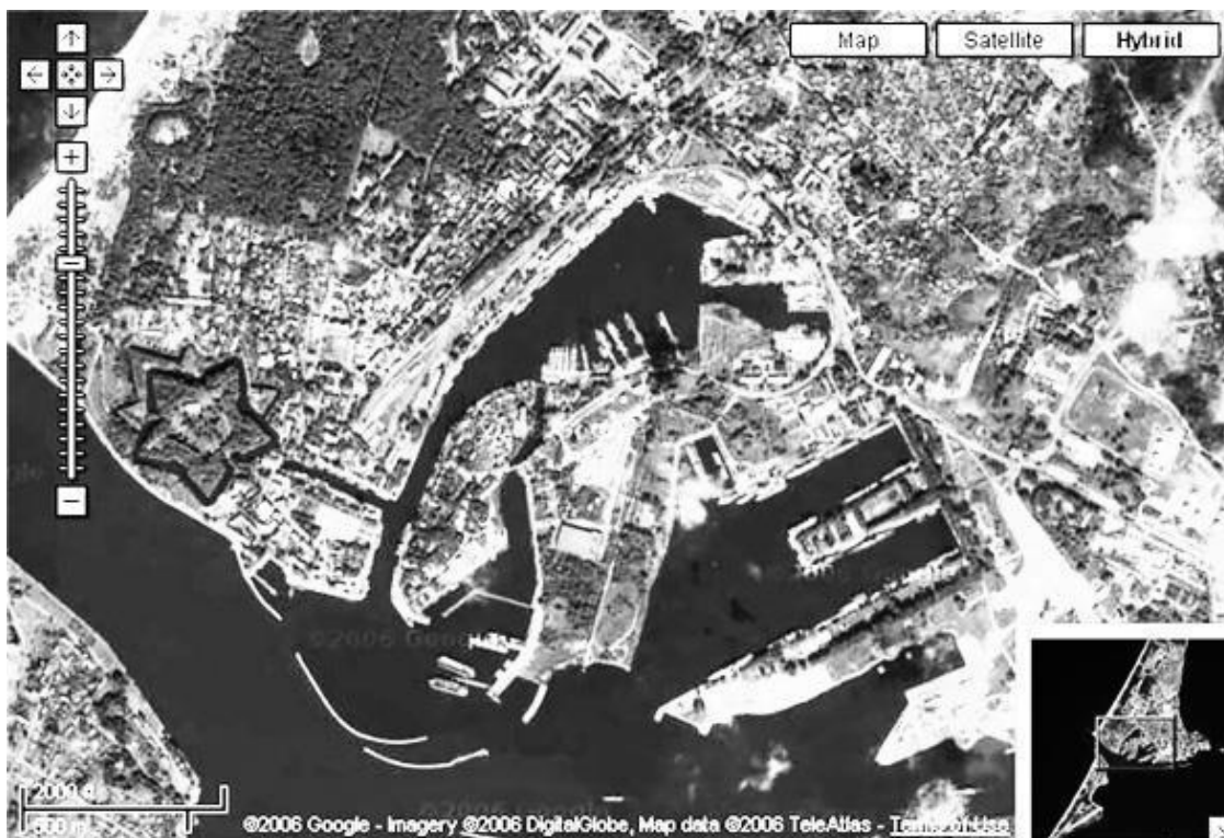
Вид на замок из космоса; http://russian-west.narod.ru

Жена рыбака на большой чугунной сковороде зажарила свежеразделанную камбалу. Одноглазая плоская чудо-рыба была обильно приправлена золотистым, крупно нарезанным луком, и источала волнующий ноздри аромат. Гость, приехавший на машине, сидел за столом в ожидании угощения. Он мирно беседовал с хозяином, и по всему видать, что здесь он не впервые. Если бы в это время кому-нибудь еще было дозволено попасть в это жилище, человеку не праздному, но доверенному и внимательному, он бы наверняка заметил, что хозяин приветствует человека, как две капли воды похожего на гаулейтера Восточной Пруссии Эриха Коха. Гость, которому было уже за пятьдесят, наконец с удовольствием принялся за угощение.