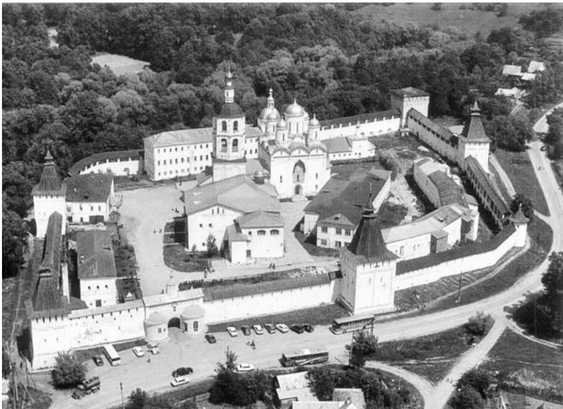
Вид с высоты птичьего полета.