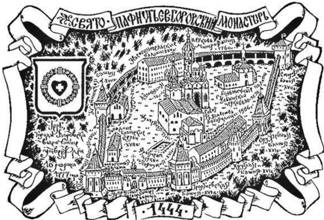
Черников. Схема Боровско-Пафнутьевского монастыря.