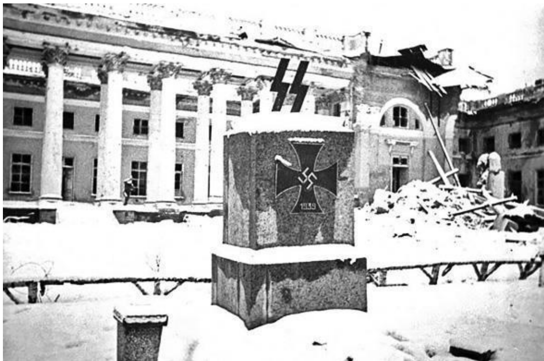
Фасад Александровского дворца и памятник на могиле немецких солдат.