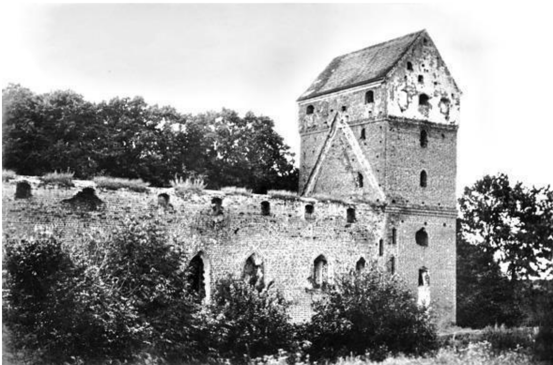
Замок Бальга на старом фото.

Важный нюанс: почти все замки Восточной Пруссии были разрушены союзниками в годы Второй мировой войны. Тайный умысел содеянного остался в стороне от внимания историков.