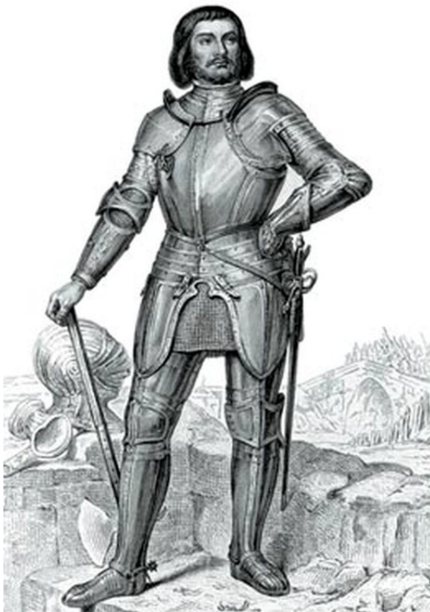
Маршал Жиль де Ре. Гравюра неизвестного художника