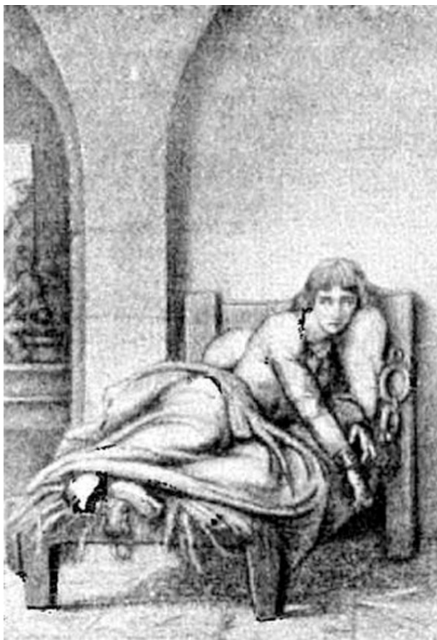
Жанна в тюрьме. Рисунок Бенувийя

подхватил исхудавшее тело, и что-то прошептав, стряхнул тяжелые кандалы. Тотчас перина из тухлой соломы превратилась в ворох свежей вкусно пахнущей травы. Рибаджо бережно посадил Жанну на обновлённую постель.