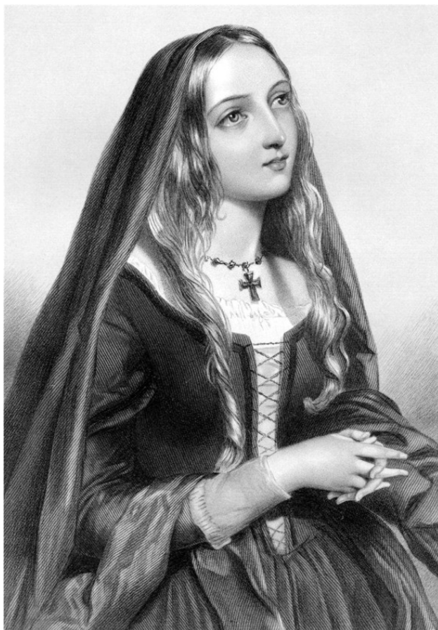
Гравюра викторианской эпохи

– Поздравляю тебя, Васюшка, с окончанием учебного года, – сказал Рибаджо и хитренько прищурил глазки.