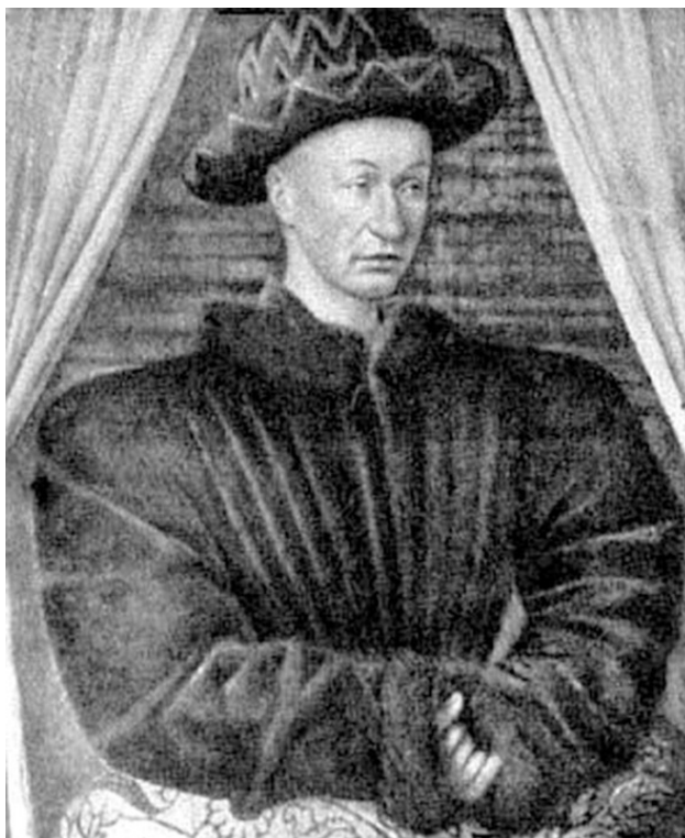
Карл VII, король Франции. Современный портрет Ж. Фуке

– Всевышний дал мне дар предвидения, – Жанна опять улыбнулась своему воспоминанию, – я узнала дофина сразу, хотя он совсем не был похож на короля. Маленький, тщедушный, нервный. Что делать? Господь не дал Франции другого, пришлось помогать этому.