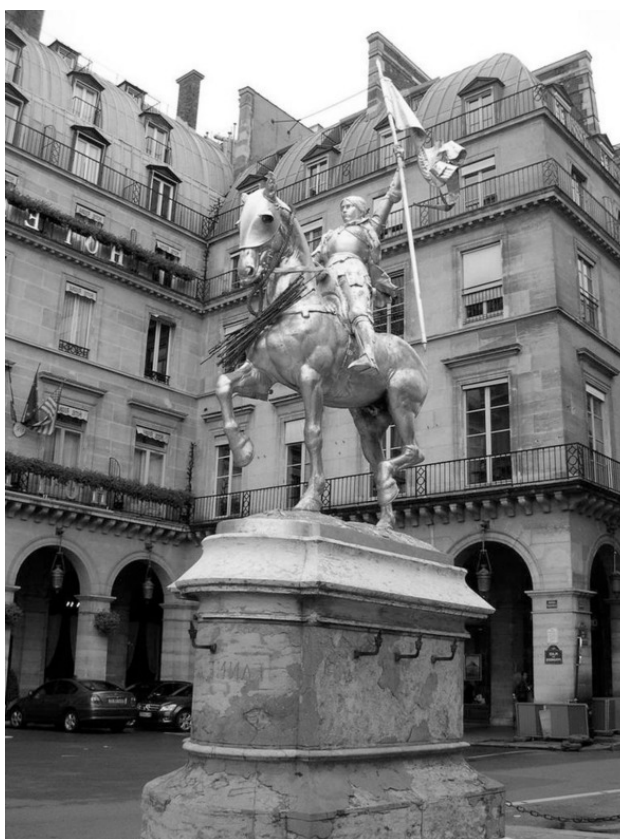
Памятник Жанне в Париже

– Я волшебник, мама, я могу быть одновременно всюду. – Рибаджо восстановил сбившееся дыхание. – Я вернулся туда, на пепелище, что-то не давало мне покоя! Площадь была безлюдна.