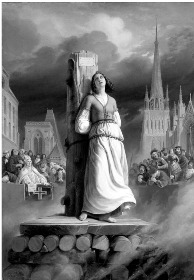
Казнь Жанны де Арк.

– Жанна, это же Жанна де Арк! – изумлённо догадалась мама, – Так вот где вы были!