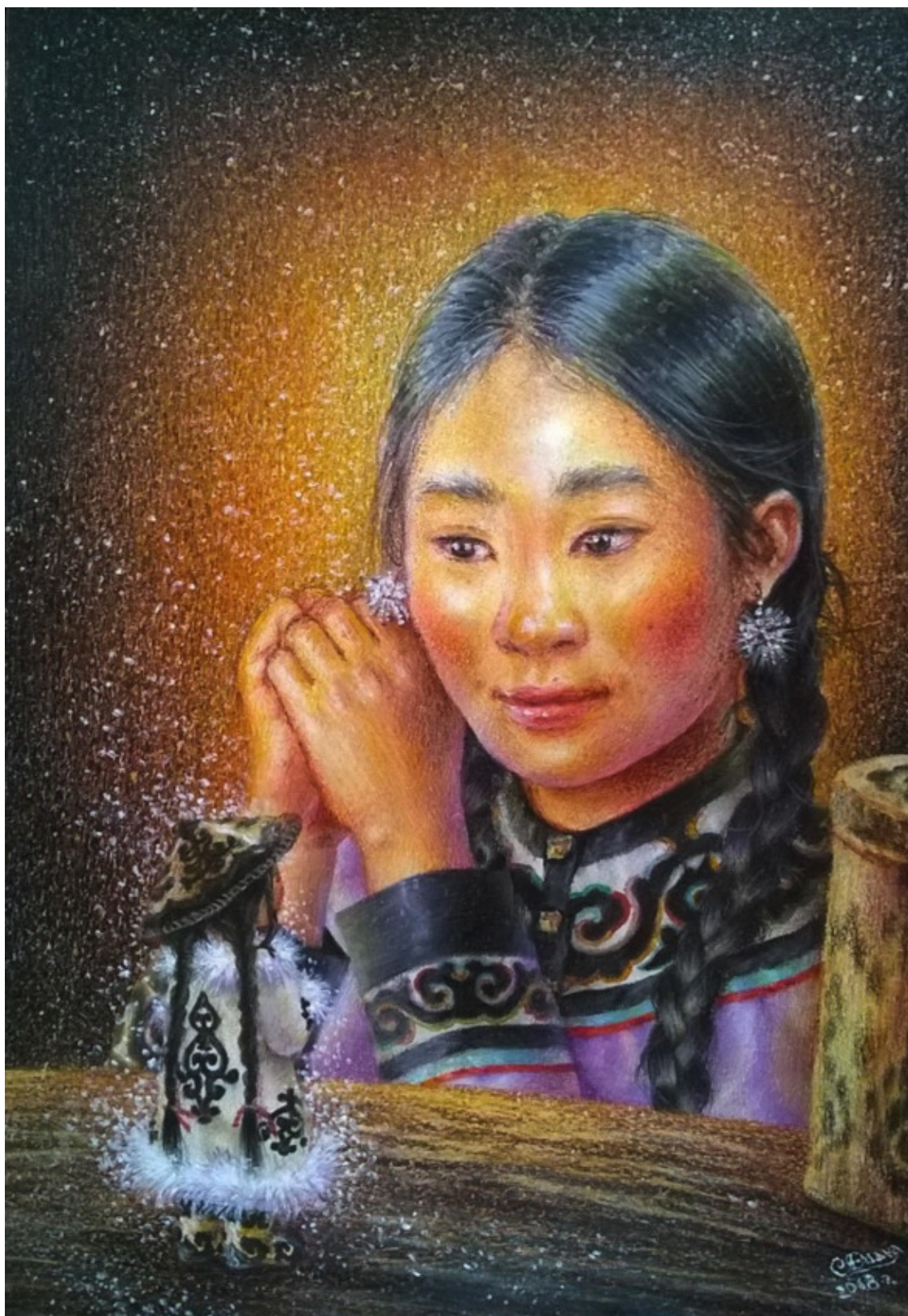
Автор сказки и иллюстрации – Диана Слипецкая