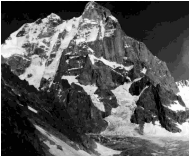
Умба Ю. «Столб»