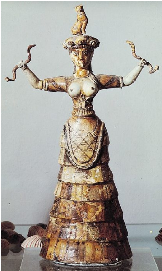
Жрица со змеями.