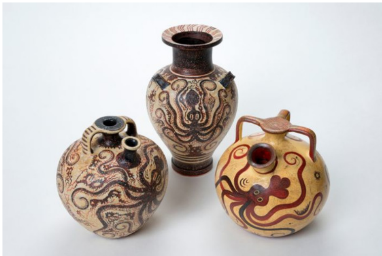
Минийские кувшины с осьминогами.

– Ты, наверное, голоден, Ва-Си-Ли, – протянула жрица, – пошли, отведаешь нашей еды.