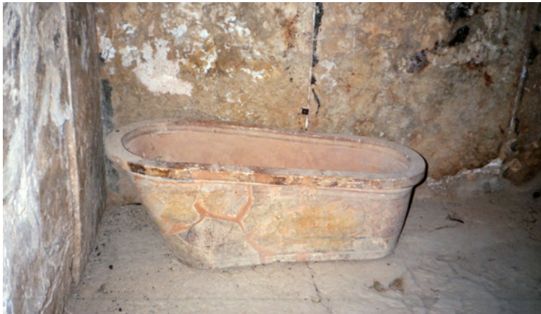
Древнекритская ванна, найденная в Кносском дворце.

Но негр сложил на груди руки, поклонился Василию и указал на широкую деревянную скамью, рядом с ванной. Показывая знаками, что он ему сделает массаж.