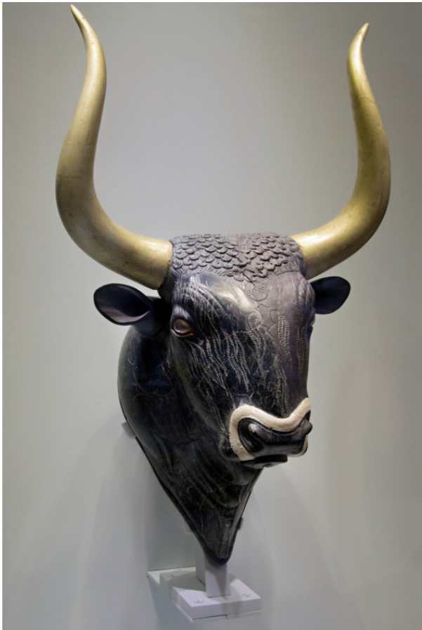
Ритон в форме головы быка, найденный в Кнососе.