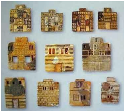
Фасады минойских домов, изготовленные из фаянса.

Вскоре домов стало еще больше, и пейзаж вдоль дороги стал похож на пригород большого города. Паланкин переехал по мосту через довольно широкую реку, на которой было видно несколько парусников.