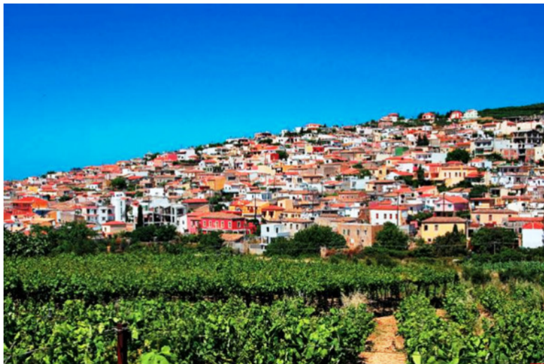
Вид на деревушку Арханес.