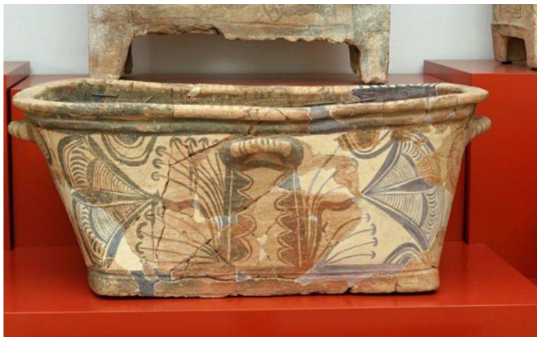
Критская ванна из Археологического музея Ираклиона .

в доме его бабушки, когда он был маленьким. Как все дети, он любил своих бабушку и дедушку, которые окружали его постоянно заботой и любовью. Но, к сожалению, они рано ушли из жизни.