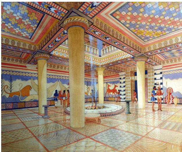
Реконструкция одного из залов Кносского дворца.

– Великая богиня Потния дала откровение, что к нам придет человек из будущего. Никто не знает, почему она тебя привела сюда. Желания богов и силы природы вне нашего разума. Мы ждали тебя, чужестранец, и вот ты здесь. Я хочу, чтобы ты чувствовал себя спокойно и мирно, пока находишься на нашей земле. Тебе ничего не угрожает. Боги тебя защищают. Может, ты знаешь, зачем ты тут?