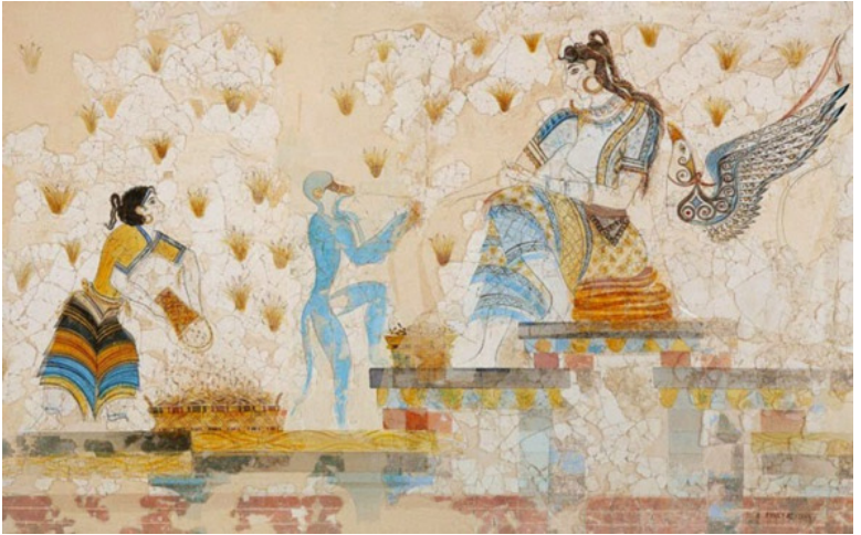
Минийская фреска, изображающая поклонение Потнии.