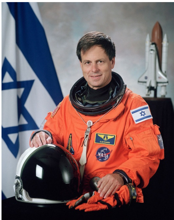
Илан Рамон – первый израильский астронавт

В 2003 году на борту американского многоразового космического корабля «Колумбия» стартовал первый израильский астронавт полковник Илан Рамон (родился 20 июня 1954 года, погиб 1 февраля 2003 года в небе над Техасом) – лётчик израильских ВВС. Совершил 16-дневный полёт на американском космическом орбитальном корабле «Колумбия», который потерпел крушение при входе в плотные слои атмосферы при возвращении на Землю.