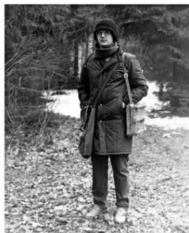
На этюдах на Клязьме. 1987г.