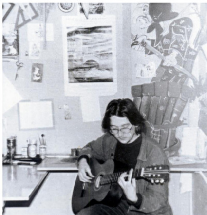
В художественной мастерской в ЦВР. 1991г.