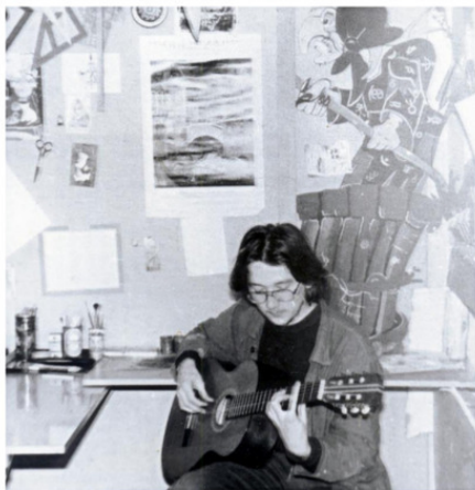
В художественной мастерской в ЦВР. 1991г.