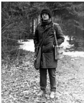
На этюдах на Клязьме. 1987г.