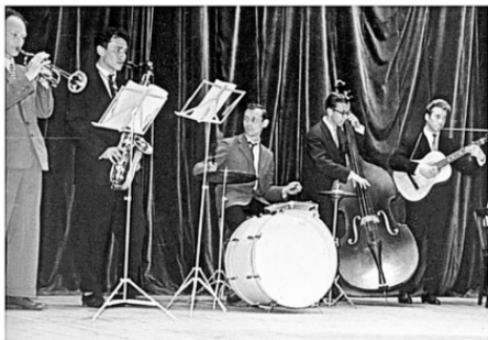
В свободное время отец играл на ударных в джаз-банде. 1960г.