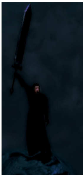
Дэтвалкер. Черный мечник.

Только один удар лапы этого чудовища вывел из строя три человека. Его грозный рев не прекращался. Оказывающее сильное давление на окружающих, создавало чувство будто голова вот-вот взорвется. Однако, несмотря на это, для черного мечника он был слишком слаб. Дэтвалкер схватил свой огромный меч и резко ударил по плечу, отрубив конечность. Зверь заревел от боли, но все равно продолжал буйствовать. И так, удар за ударом, черному мечнику удалось одолеть обезумевшего монстра. Последняя его техника снесла ему голову. Все были восхищены нечеловеческой силой черного мечника и стали радоваться победе над врагом.