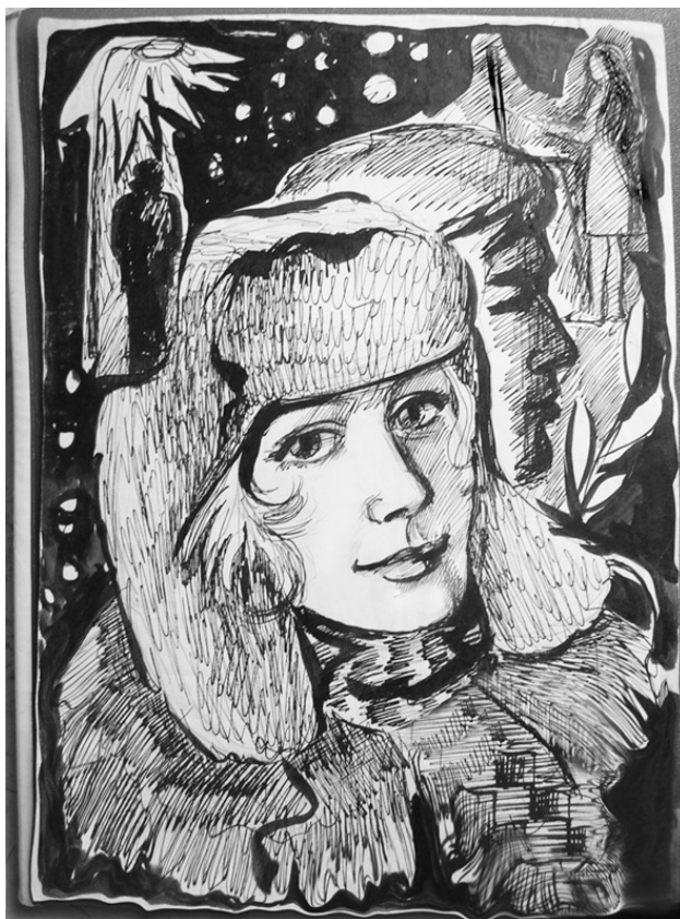
Иллюстрация – Людмила Сотникова