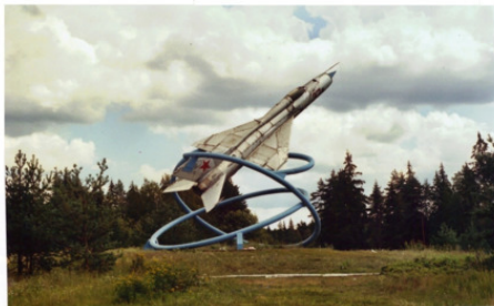
Самолет на перекрестке. Трасса Петербург -- Вологда