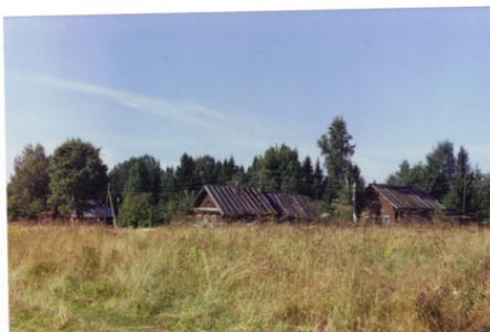
Вид на западную сторону Камар