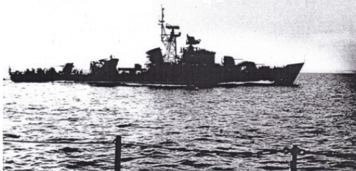
Сторожевой корабль. Проект 50