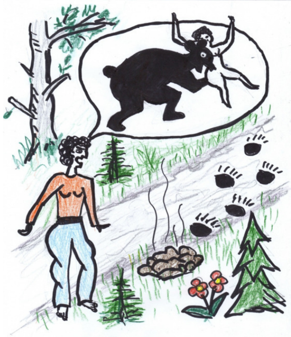
У Сони заработало воображение

К любой длительно действующей опасности, даже если она первоначально и вызвала острую реакцию, человек постепенно привыкает. Привыкнув к необычному соседству