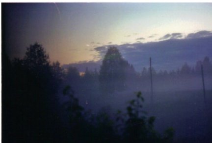
Белая ночь в Камарах