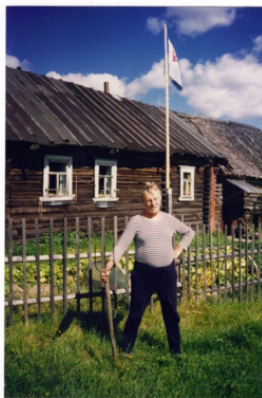
День военно-морского флота