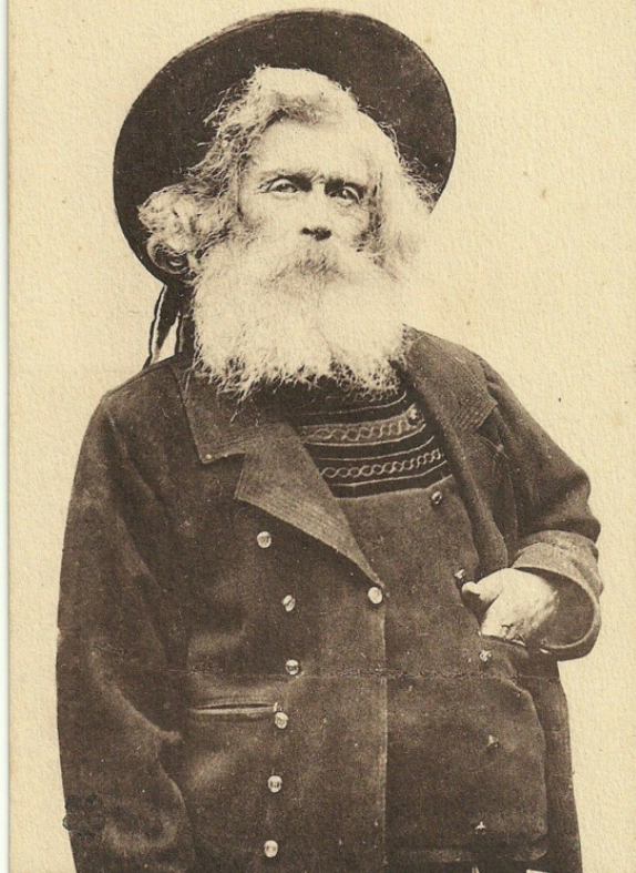
2290. Costume de Pont l'Abbé — Vieux Chouan

Луи Станислав вступил в Королевскую и Католическую Армию в шестнадцать лет, не достигнув призывного возраста, так что ему не угрожал непосредственно призыв