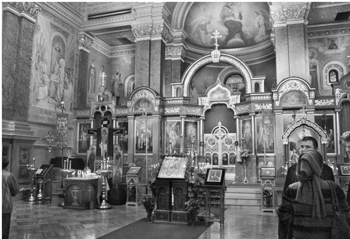
Свято-Николаевский патриарший собор в Нью-Йорке (интерьер храма)

Именно с этого рассказа начинается первая глава четвертого сборника «Православие в США: многообразие как особенность американской культуры».