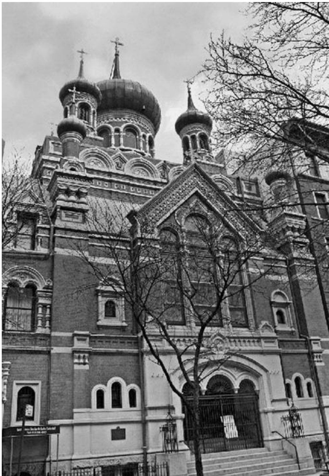
Свято-Николаевский патриарший собор в Нью-Йорке

Пребывая на американской земле, мы особым образом воспринимали благословение Святейшего Патриарха Тихона, оказываясь в тех местах, где бывал и трудился он сам. Мы – в Нью-Йорке, в городе, где святитель Тихон начал свое служение в Америке. Здесь принималось решение по реорганизации кафедры – сюда из отдаленного Сан-Франциско святитель Тихон