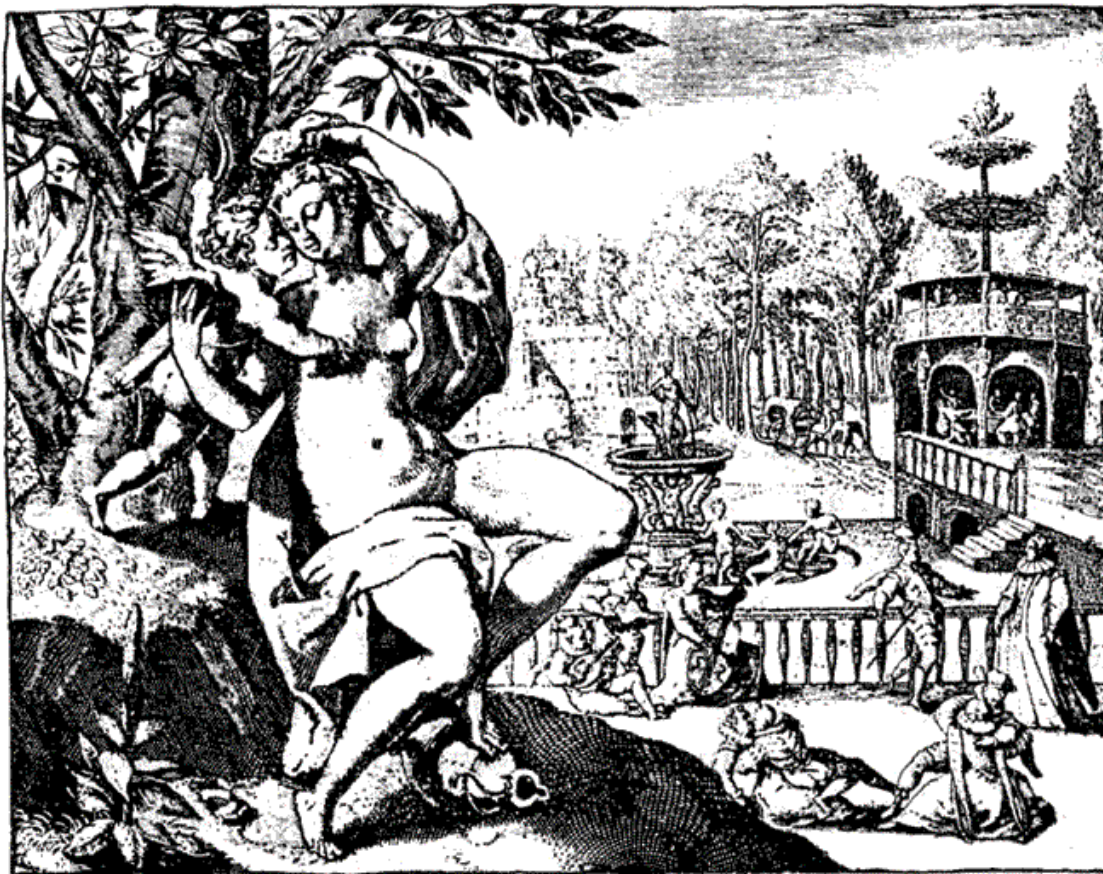
Де Жод. Радости Венеры. XVII в.

Собственно германский по своему происхождению, этот обычай совершался самым разнообразным образом, официально, с большой торжественностью, в серьезном религиозном тоне, в присутствии священника, освящавшего ложе, но и юмористически. Общеизвестна форма, в которую этот обычай вылился при княжеских дворах. Так как в этой среде брак носил чисто условный характер, будучи обычно своего рода политическим договором, в силу которого одно государство передавало другому известную территорию или права на власть, олицетворенные в образе невесты, то молодые могли и не видеться до брака: ведь личная склонность не входила как фактор в решение арифметической задачи. Сделка завершалась публичным разделением ложа, причем сам жених мог и отсутствовать, его роль мог взять на себя уполномоченный посланник, которому было поручено устройство сделки. Он ложился спокойно на парадное ложе рядом со «счастливой» невестой как официальный заместитель своего господина, и дело считалось сделанным, т. е. брак считался юридически заключенным.