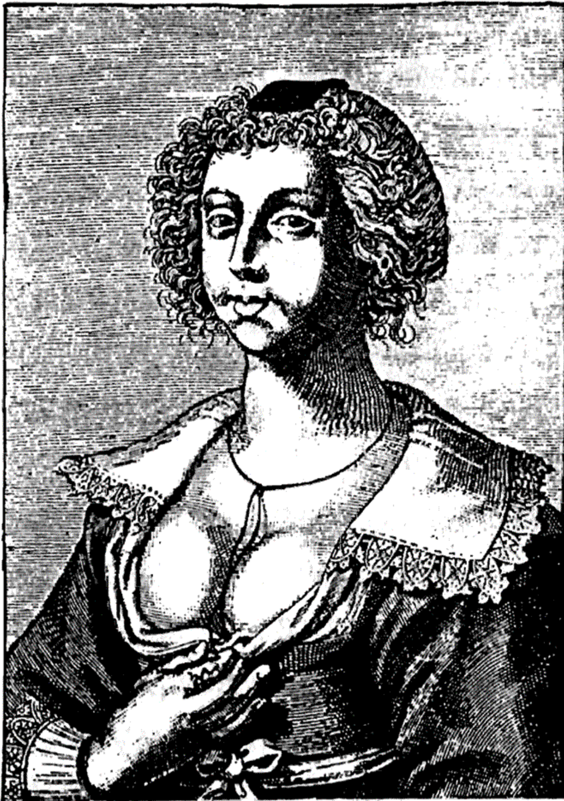
Костюм голландской проститутки. XVII в.

Этот кодекс красоты был повсюду облечен в форму стихотворных афоризмов и дошел до нас в целом ряде вариантов, притом иногда с иллюстрациями. Достаточно привести один пример.