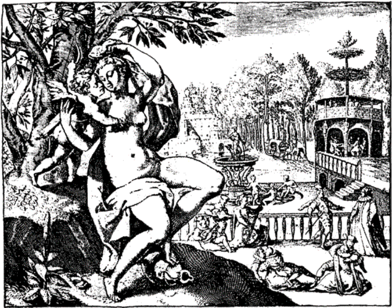
Де Жод. Радости Венеры. XVII в.

Собственно германский по своему происхождению, этот обычай совершался самым разнообразным образом, официально, с большой торжественностью, в серьезном религиозном тоне, в присутствии священника, освящавшего ложе, но и юмористически. Общеизвестна форма, в которую этот обычай вылился при княжеских дворах. Так как в этой среде брак носил чисто условный характер, будучи обычно своего рода политическим договором, в силу которого одно государство передавало другому известную территорию или пра-