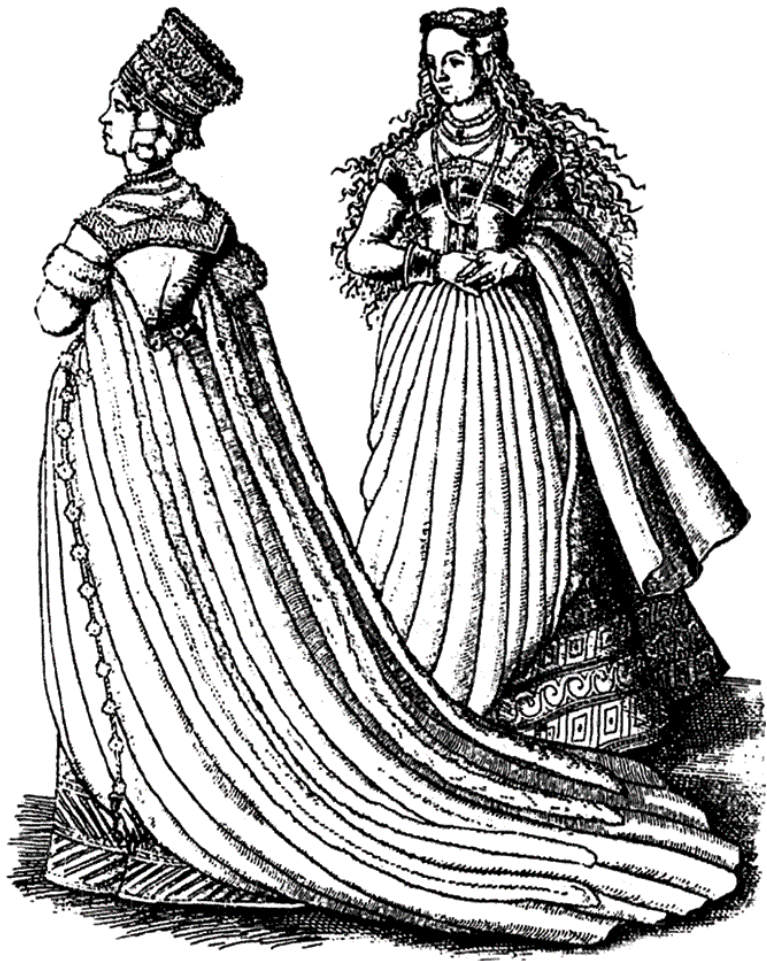
Женские моды. XVI в.