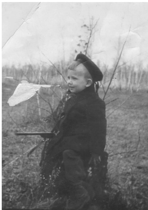
Ил. 6. На «охоте». Роща в окрестностях омской Московки.