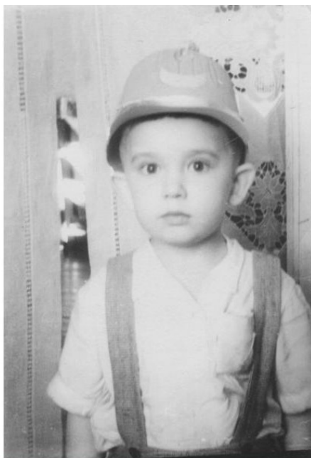
Ил. 8. Откуда и с чего появилась такая турецкая феска—ума не приложу.