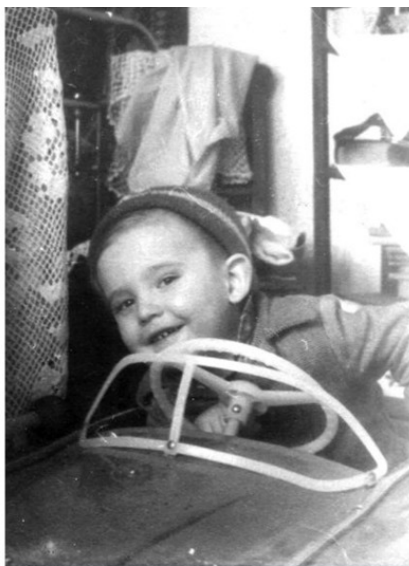
Илл. 7. До сих пор удивляюсь, как родители решились, а бабушка-дедушка разрешили, держать огромную игрушку в двухкомнатной квартире, где жили 6-7 человек.