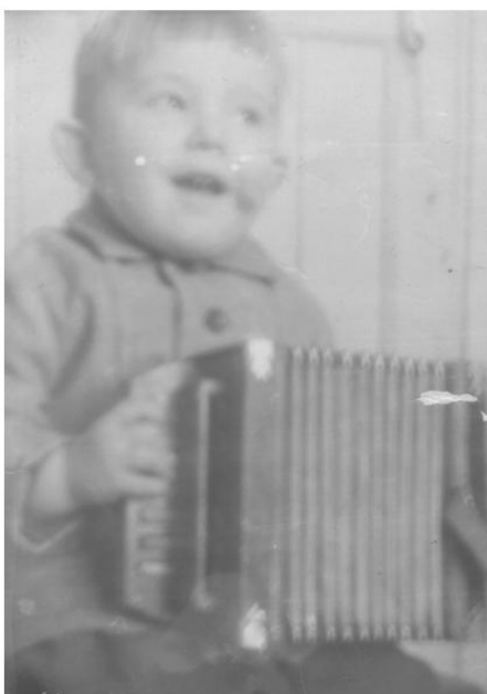
Ил. 9. Фото сделано задолго до «Чебурашки».