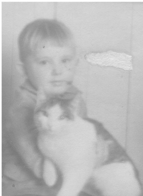
Ил. 5. Любовь к собакам и кошкам была заложена в детстве. Наш домашний кот. Один из первых. Одна из первых фотографий отца (ф-т «Смена»).