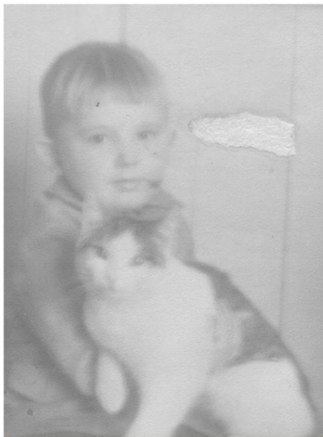
Ил. 5. Любовь к собакам и кошкам была заложена в детстве. Наш домашний кот. Один из первых. Одна из первых фотографий отца (ф-т «Смена»).