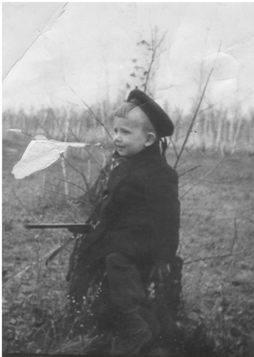
Ил. 6. На «охоте». Роща в окрестностях омской Московки.