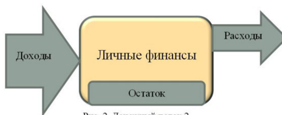
Рис. 2. Денежный поток 2

Путь 1 — увеличить объем поступлений, т. е. ДОХОДЫ , не изменяя при этом объем РАСХОДОВ .