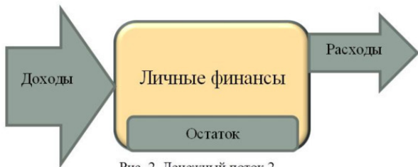
Рис. 2. Денежный поток 2

Глядя на рис. 2, видно, что при увеличении доходов и неизменном состоянии расходов объем личных финансов увеличивается и остается остаток неизрасходованных средств. Этот остаток неизрасходованных средств называется «инвестиционный капитал». Это очень важный шаг – сформировать свободный инвестиционный капитал, увеличивать его до максимального значения и правильно распоряжаться этим капиталом.