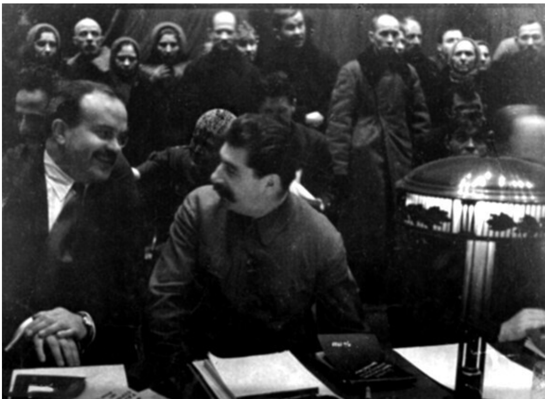
С Вячеславом Молотовым

тельными» для интеллигента, были сомнительны. Образование многих из них не соответствовало их провозглашаемому статусу «выдающихся ученых», «продолжателей научных теорий». Фразу, брошенную Лениным в «Письме к съезду» в отношении Бухарина («он никогда не учился») следует понимать почти буквально: «великий теоретик» партии не имел высшего образования, достаточного для научной работы, так как после нескольких месяцев учебы в университете покинул его ради революционной работы. Не имел высшего образования и автор «теории перманентной революции» Троцкий, который был арестован после годичного пребывания в университете Николаева и потом нигде не учился. Не имел законченного высшего образования и «теоретик» Г.Е.Зиновьев. Это не было удивительным: к моменту написания Лениным его письма в партии лишь 5 процентов ее состава имели высшее образование, а 84 – обладали лишь «низшим», «домашним» и подобными видами «образования».