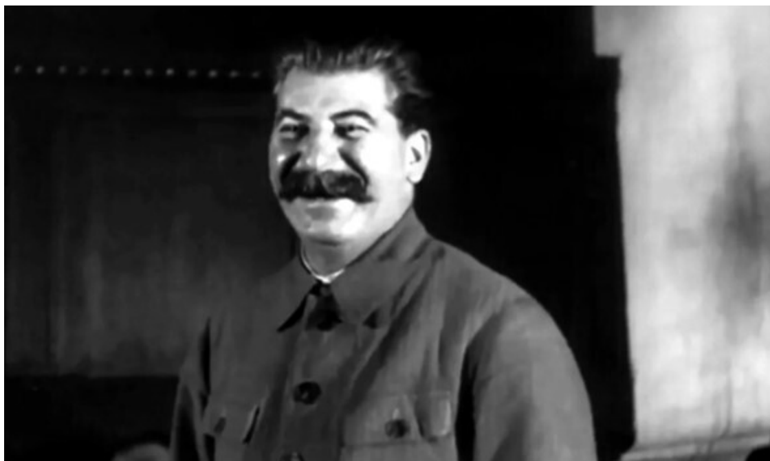
Товарищ Сталин улыбается