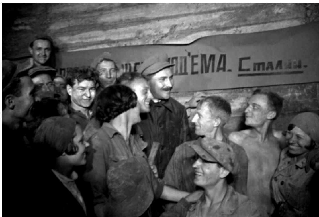
Лазарь Каганович с метростроевцами