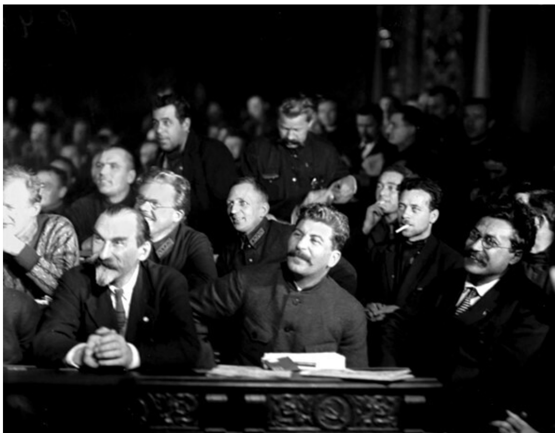
На одном из многих заседаний...

Полвека назад у большинства советских людей, а также миллионов людей в Китае, Польше, Румынии и ряде других стран мира не было сомнений в том, что пребывание у власти в СССР Сталина – это лучшая гарантия быстрого и победоносного движения их стран к счастливой жизни. В «Краткой биографии» Сталина, выпущенной в 1947 году, говорится: «И.В. Сталин – гениальный вождь и учитель партии, великий стратег социалистической революции, руководитель Советского государства и полководец... В Сталине миллионы рабочих всех стран видят своего учителя, на классических трудах которого они учились и учатся, как нужно успешно бороться против классового врага, как нужно готовить условия конечной победы пролетариата». Таким образом, обосновывалось утверждение советской пропаганды о безупречной и безошибочной политике коммунистической партии в период правления И.В. Сталина. С тех пор эта однозначная и заведомо упрощенная оценка его личности и политики коммунистической партии в те годы существенно изменилась во многих странах мира.