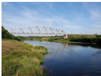
Река Дон у железнодорожного моста

Хорошо, что сегодня в Интернете появилась сайты истории российских городов, в том числе сайт с историей г. Данкова. Большое спасибо данковским создателям сайтов, «раскопавшим» историю города. Я использую эти сайты в своих воспоминаниях для описания Данкова, так как без привязки к месту многие события будут непонятны.