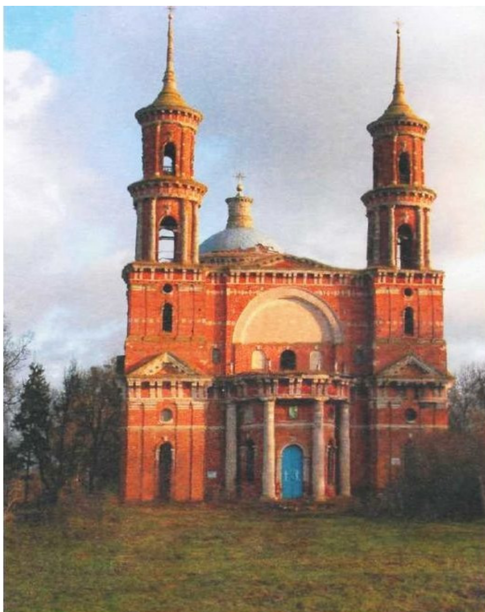
Храм в селе Баловнево Данковского района