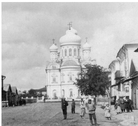
Тихвинский собор в центре г. Данкова