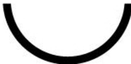
Рис. 5. Дуга в прямом положении

Ее обычно трактуют как чашу, содержащую духовную энергетику герметической традиции (нехристианской линии религиозных и философских учений, распространенных в античном мире в I–II веках нашей эры).