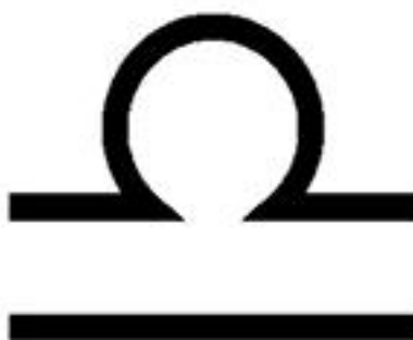
Рис. 2. Зодиакальный знак Весы

Она представляет собой линию горизонта, разделяющую Землю и Небо. Поэтому астрологический символ зодиакального знака Весы (рис. 2), который позаимствован из символической системы Древнего Египта, имеет в основании горизонтальную линию, буквально обозначающую Землю.