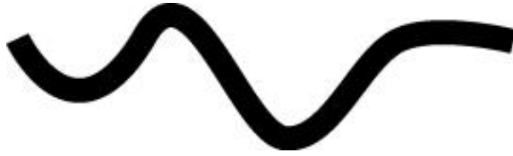
Рис. 4. Кривая линия

Но в более поздний период понятие какой бы то ни было кривизны получило в славянском фольклоре и мифологии отчетливый негативный оттенок. Кривда стала олицетворением лжи и противостояла Правде. Кривым путем герои сказаний и былин добивались того, чего никак не могли получить, действуя напрямую.