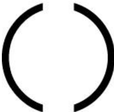
Рис. 9. Вертикальная дуга, расположенная краями внутрь

Вертикальные дуги, направленные краями внутрь (рис. 9), служат символом непроявленного духа, находящегося в состоянии промежуточного равновесия, и в совокупности выражают возможность жизни или смерти.