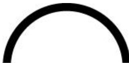
Рис. 7. Дуга в перевернутом положении

Перевернутая дуга, или опрокинутая чаша, (рис. 7) означает состояние, при котором нет возможности удерживать сокровища духа, указывает на крайнюю инерцию и отсутствие жизни. Такое положение дуги в оккультной традиции соотносится с принципом отдачи. В индийской традиции рука, согнутая в локте и упирающаяся кончиками вытянутых пальцев в плечо при обращенной вниз ладони, образует мудру Тарпана, выражающую почтение и подчинение.