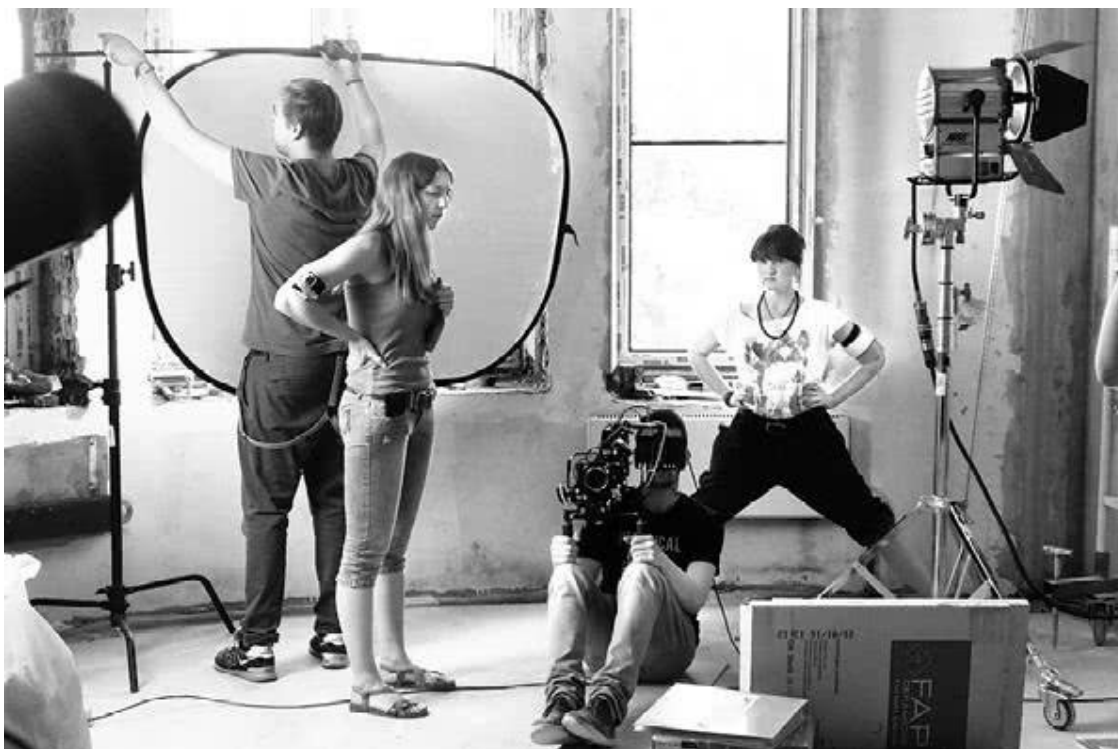
Студенты курса «Фильммейкинг» на съемках

Когда я был маленьким (в 70-е годы прошлого века) фотографией занимались либо профессионалы, либо увлеченные и кропотливые любители. Они должны были уметь выбрать подходящие для съемки фотоаппарат и пленку, настроить экспозицию и диафрагму, в полной темноте на ощупь зарядить пленку в проявочный бачок, подготовить специальные реактивы и обработать пленку, соблюдая температурный и временной режим, а затем при свете красного фонаря, который не портит фотобумагу, отпечатать снимки и обработать их химикатами. Это был трудоемкий процесс, требующий времени и усидчивости. Когда мой отец «колдовал» с фотоувеличителем в ванной комнате, дверь которой была завешена шерстяным одеялом, он казался мне настоящим волшебником. И тем не менее, фотографирование даже тогда было весьма популярным хобби.