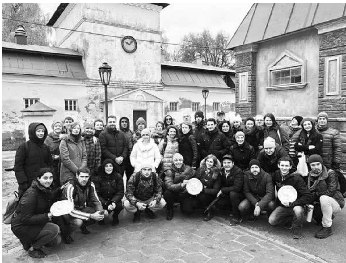
На посвящении в студенты. Горки Ленинские, октябрь 2017 г.

К концу девяностых я уже почти шесть лет довольно успешно занимался рекламно-информационным бизнесом в Саратове, но все еще жаждал перемен – «перестроечные» настроения были еще живы. И вот в феврале 1998 года на отечественные киноэкраны, которых было не так уж много, поскольку отечественный кинопрокат только начинал восстанавливаться после затяжного кризиса, вышел легендарный «Титаник» (реж. Дж. Кэмерон, 1997 г.). И люди хлынули в кинотеатры – от фанаток молодого, смазливого и уже тогда гениального Ди Каприо до серьезных любителей кино, которые не могли пропустить такое зрелище. «Титаник» наглядно продемонстрировал, что желание ходить в кино, чтобы коллективно, сидя вместе со всеми в большом темном зале, совместно переживать сильные эмоции, у людей никуда не исчезло.