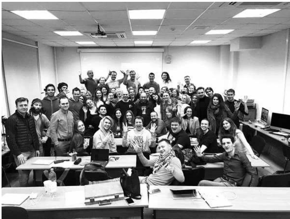
Студенты-фильммейкеры Высшей школы кино «Арка» с куратором курса Тимуром Бекмамбетовым

А еще фильммейкинг – это первый шаг в «большое кино», в сторону красной ковровой дорожки и вожделенного Оскара. Хватит горевать о русском кино, если вас волнует его судьба – пора что-то сделать самим. Все в ваших руках, и наше время дает безграничные возможности и для творческой самореализации, и для создания того, что по вкусу именно вам. Вот только с чего бы начать? Об этом я тоже расскажу в этой книге.