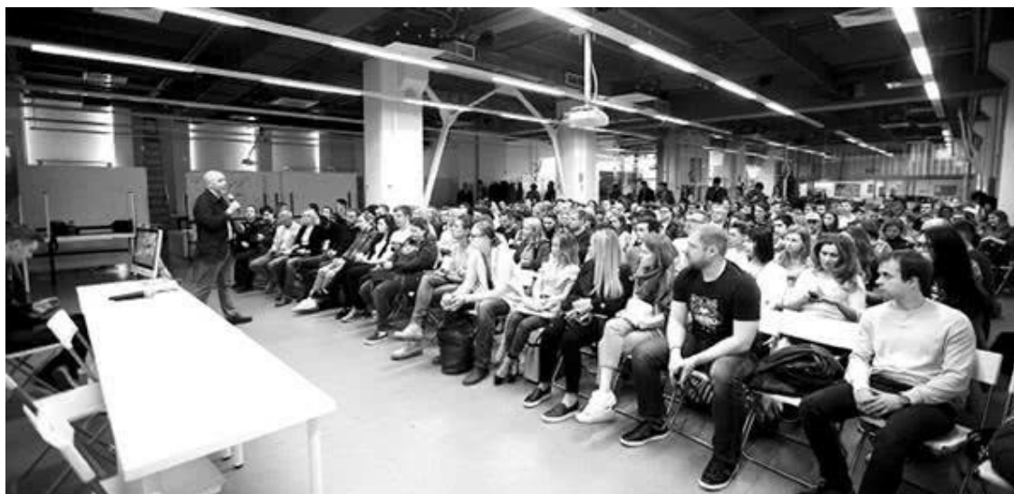
Встреча «Клуба короткометражного кино» в Московской школе кино