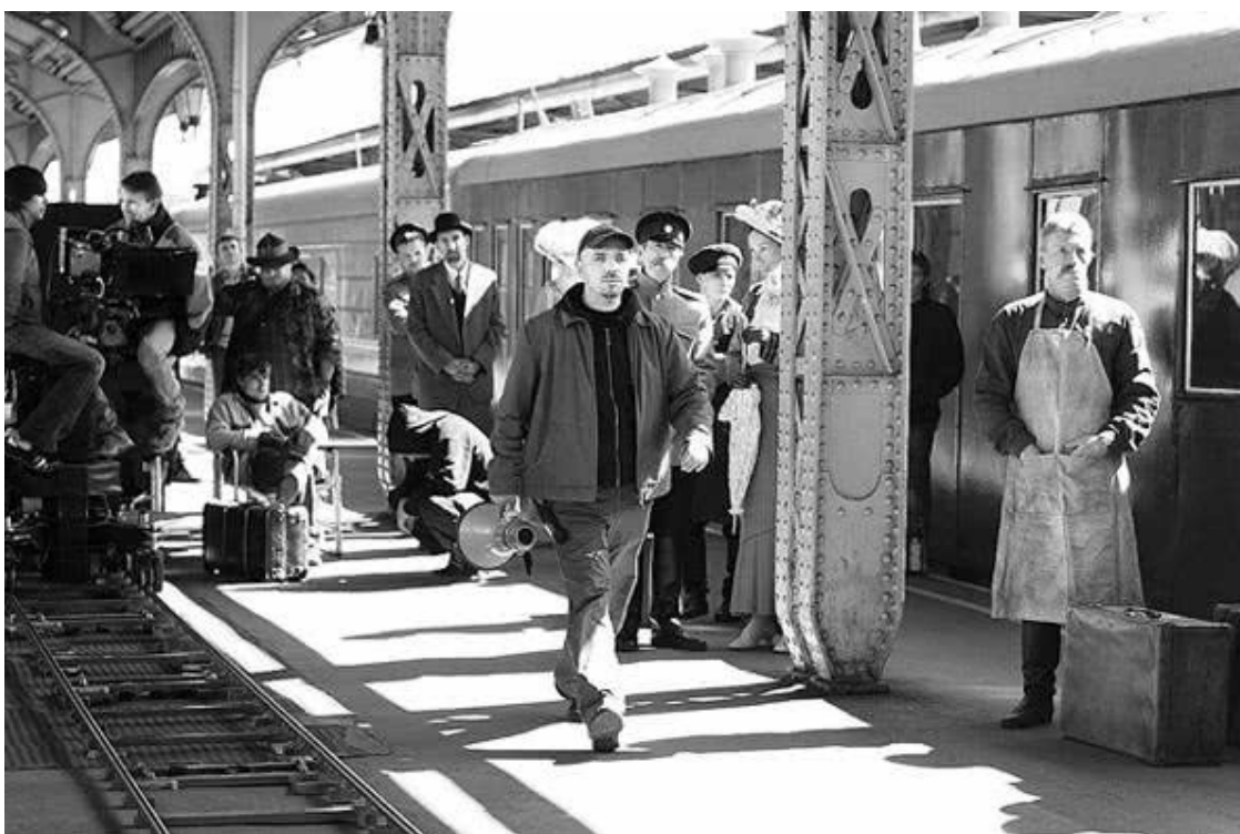
На съемках сериала «Юнкера», Санкт-Петербург, 2005 г.