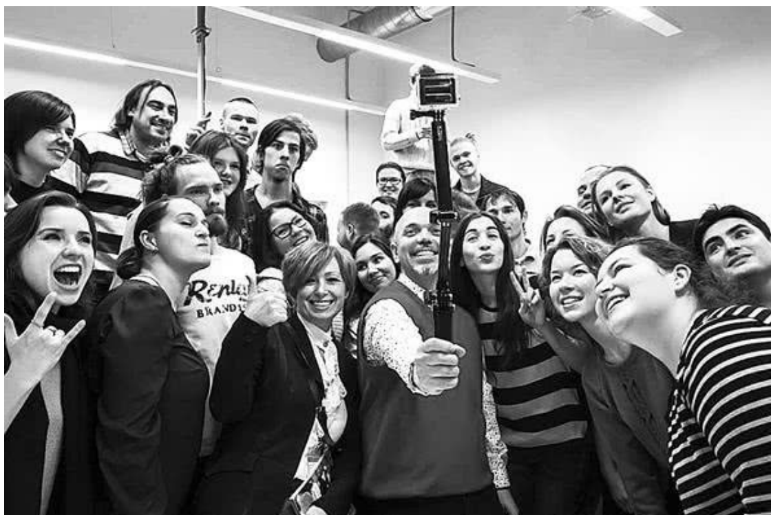
Селфи – инструмент визуала