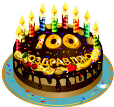
Рис. Алины Мозалевой