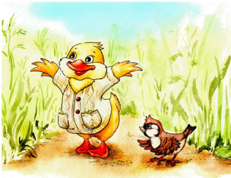
Рис. Аурики Красильниковой

«Обновки из шерсти овечьей — Нет мягче, теплей, долговечней!»