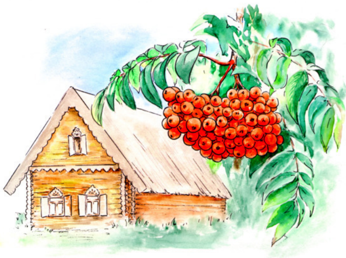
Рис. Аурики Красильниковой