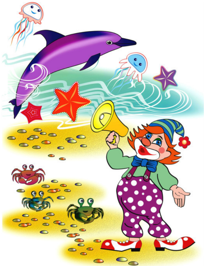
Рис. Натальи Гаркуши