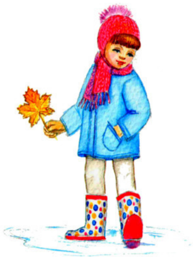
Рис. Валерии Якуповой

Хвалились новые Кроссовки, — И был Сергей в забеге первым, У конкурентов сдали нервы! Мы обошли их всех, ликуя, Подошвы под собой не чуя. Не зря зовут нас «1-м сортом», Совет вам всем заняться спортом. Тут покосились на соседа