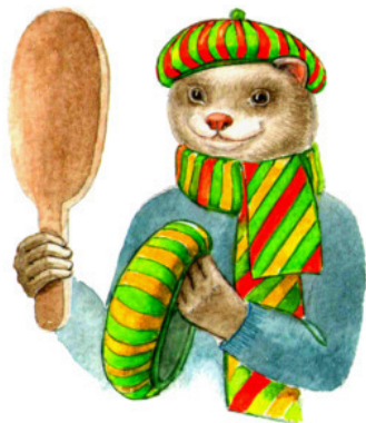
Рис. Валерии Якуновой

Мы Зайчику купим фужайку, Что вяжут искусно хозяйки. Хорьку подберём два берета И шарфик похожего цвета. А милому увальню 36 Мишке Нужны на подкладке штанишки И вязаное одеяло, Чтоб в пяточки не надувало.