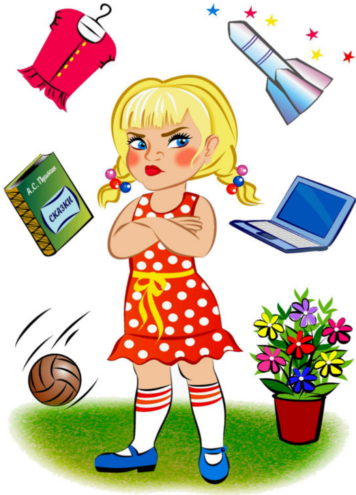
Рис. Натальи Гаркуши