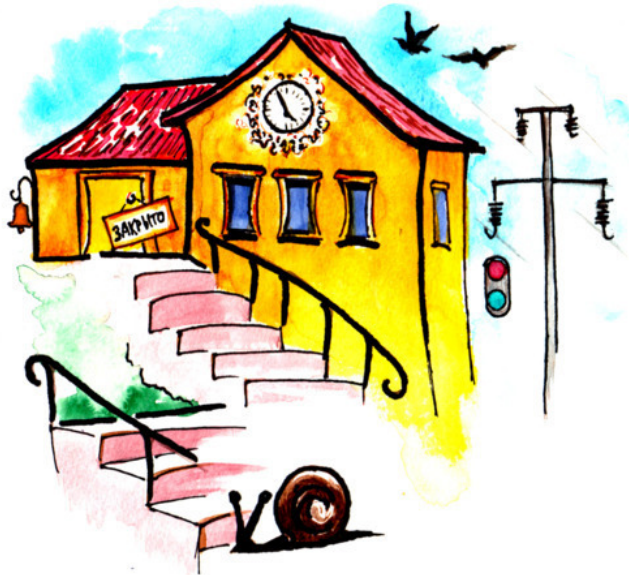
Рис. Данила Соболевского

Черепаша отвечает мудро: – Ты, Улитка, распланируй утром Всё по пунктам: полдень, день и вечер, Все мероприятия и встречи. Занеси их в записную книжку, Дай запас по времени (и с лишком). В целях экономии минутки Можешь прокатиться на маршрутке.