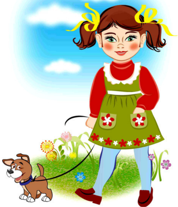
Рис. Натальи Гаркуши

Добавив фразу, как награду: «Хозяйка у тебя что надо!»