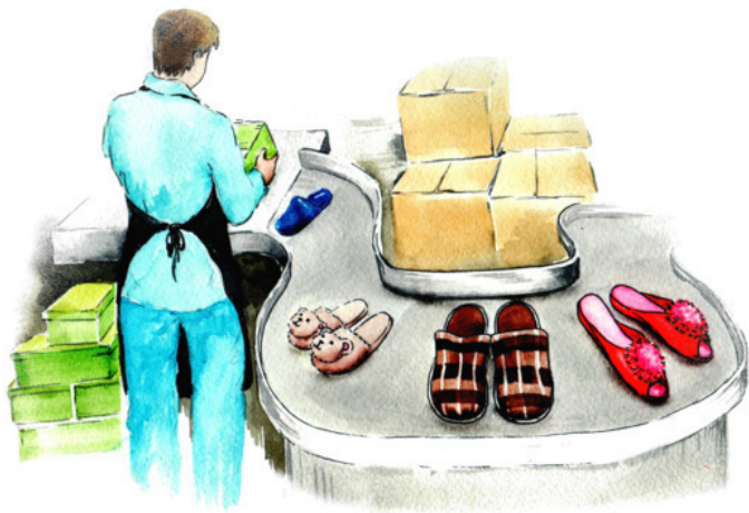
Рис. Аурики Красильниковой