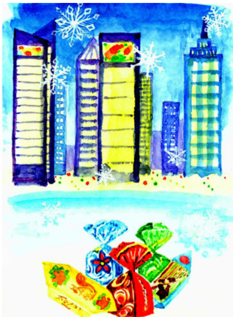
Рис. Екатерины Рехтиной