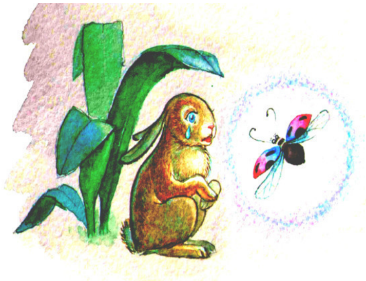
Рис. Валерии Якуновой