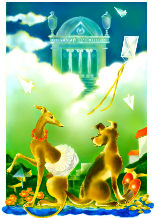
Рис. Николая Кострубина