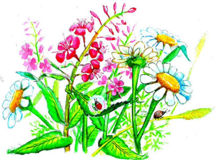
Рис. Валерии Якуновой

что без разрешения взрослых отлучаться из дома нельзя. Даже если твой дом – сплетённый из травинок гамак и большой лопух, служащий навесом от дождя.