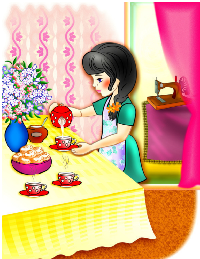
Рис. Натальи Гаркуши