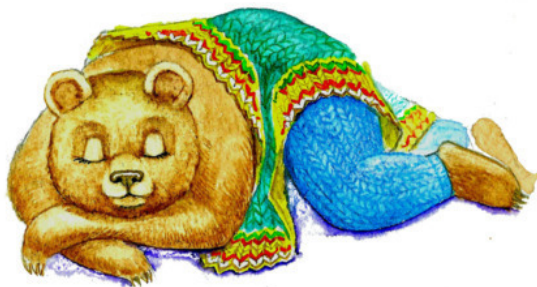
Рис. Валерии Якуновой

Всю зиму проспит он в берлоге И полон немалой тревоги: Ведь если тепло не одеться, Куда же от холода деться?