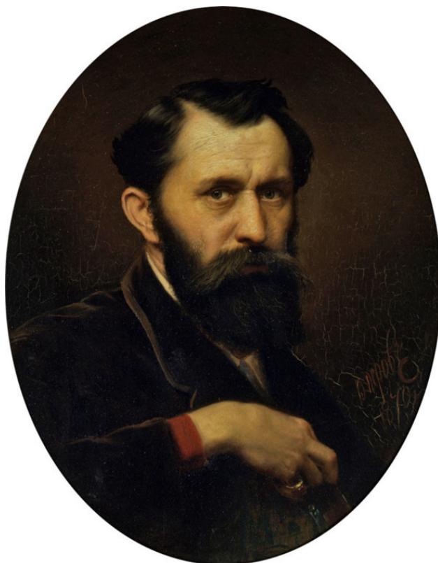
В. Г. Перов. Автопортрет. 1870 г. ГТГ