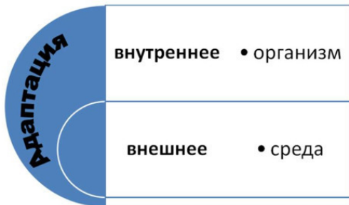
Рисунок №1. Адаптация, как выражение единства внутреннего и внешнего.

Большое внимание в научной литературе уделяется проблеме психологической адаптации. В психологии под термином «адаптация» понимается перестройка психики индивида под воздействием объективных факторов окружающей среды, а также способность человека приспосабливаться к различным требованиям среды без ощущения внутреннего дискомфорта и без конфликта со средой. При этом подразумевается процессуальная сторона собственно явления адаптации в отличие от приспособления животных, преодоления трудностей или формирования определенных свойств личности, например, профессиональных качеств.