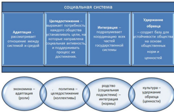
Рисунок №2. Компоненты социальной системы по Т. Парсонсу.

Конструируя унифицированную для всех социальных систем формализованную модель действия, он вводит функциональную категорию «адаптация» в качестве базовой наряду с тремя другими: целедостижением, воспроизводством, интеграцией. По Т. Парсонсу, любая общественная система имеет две основные оси ориентации. Первая ось: внешнее-внутреннее. Вторая ось: инструментальное – консуматорное. На пересечении этих осей и возникает набор из 4 основных функциональных категорий. Согласно Т. Парсонсу, адаптация – это одно из четырех функциональных условий, которым все социальные системы должны отвечать, что-