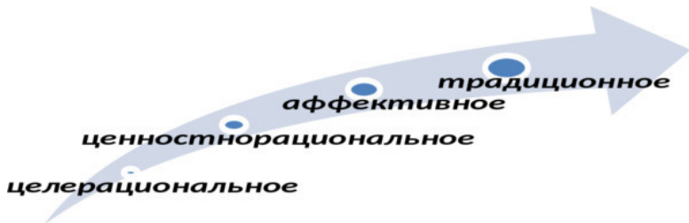
Рисунок №3. Четыре типа социального действия по М. Веберу.

Он не случайно расположил эти типы социального действия в порядке возрастания рациональности. М. Вебер убежден, что рационализация есть всемирно-исторический процесс, а адаптация является своего рода «приспособлением личности к конкретной социальной организации». 19