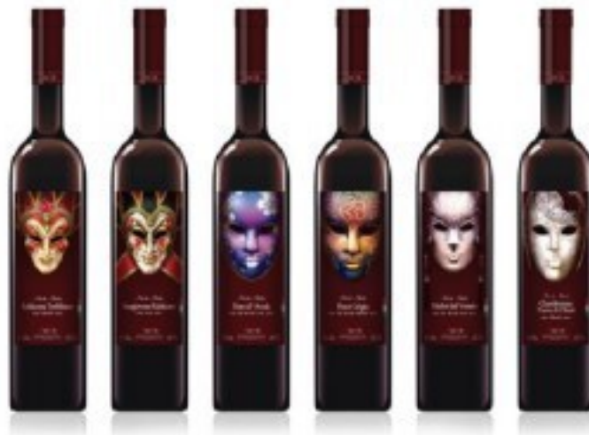
Рис. 7. Торговая марка