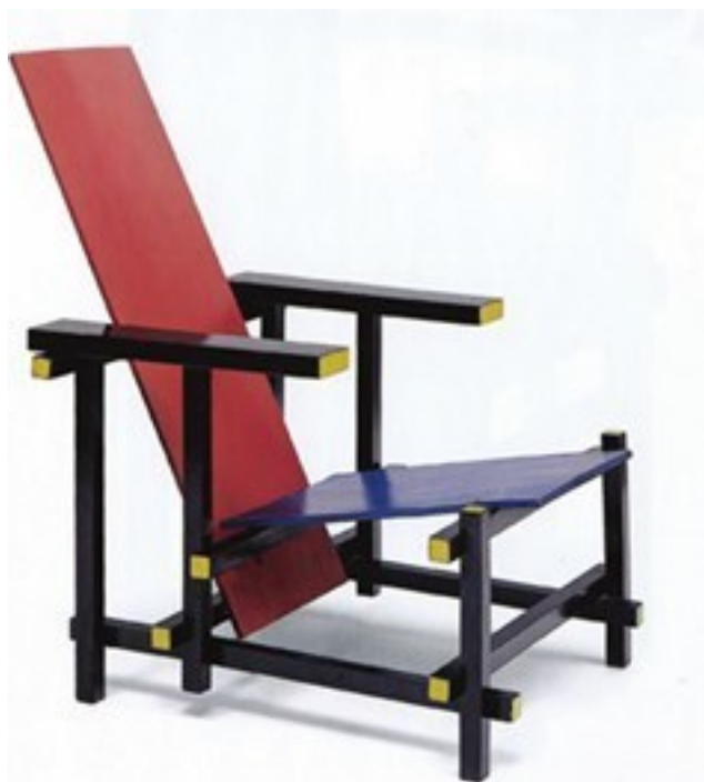
Рис. 4. Г. Ритвельд. Красно-синий стул, 1918

Индустриальный дизайн – основная группа в сфере приложения труда дизайнера (орудия труда и механизмы), к ней относятся продукты станко- и машиностроения, средства транспорта, оружие, т. е. изделия категории «А»; предметы быта – товары массового потребления (посуда, бытовые приборы, аудио- и видеоаппаратура, электроагрегаты, механизмы, детские игрушки, мебель). Они являются самой распространенной на сегодня областью дизайнерской деятельности.