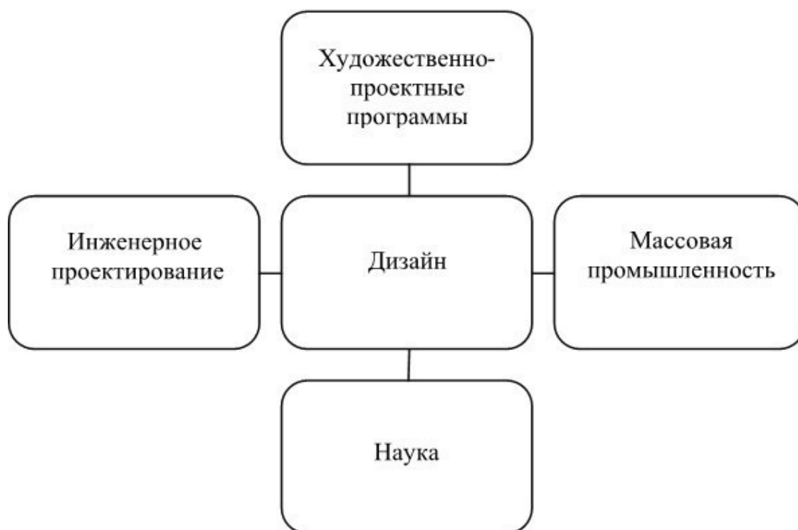
Рис. 1. Составляющие дизайна

Центральной проблемой дизайна является создание культурно- и антропосообразного предметного мира, эстетически оцениваемого как гармоничный, целостный. Следовательно, наряду с инженерно-техническими и естественно-научными знаниями актуально использование средств гуманитарных дисциплин – философии, культурологии, социологии, психологии, семиотики и др. Все эти знания интегрируются в акте проектно-художественного моделирования предметного мира, опирающегося на образное, художественное мышление.