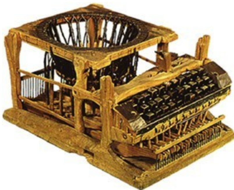
Рис. 2. Джеймс Ватт. Первая паровая машина, Англия, 1765

Дизайн как профессия существует около ста лет. Зарождение этой профессии связывают с деятельностью движения «За связь искусств и ремесел» в Англии конца XIX века, лидером которого был известный художник и теоретик в области предметного творчества Уильям Мор-рис (1834–1896) – английский художник и общественный деятель. Именно тогда были сформулированы основные положения теории и творческие принципы дизайна, повлиявшие на школы и направления более поздних лет.