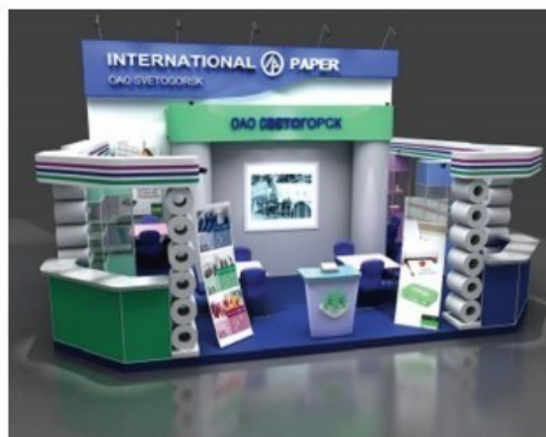
Рис. 9. Дизайн выставочных экспозиций