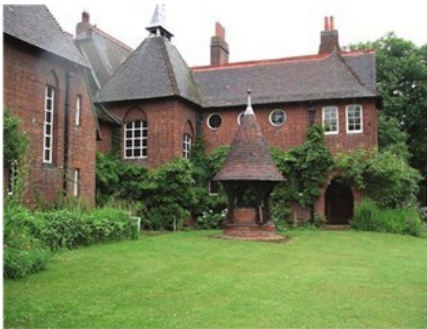
Рис. 5. У. Моррис. Red house

Каждый из этих типов пространств имеет свои особенности и определяет свой круг профессиональных задач и проектных методов их решения. В процессе своего развития дизайн сначала представлялся в виде автомобилей и киосков, затем торговых автоматов и телефонных боксов, пока не сменил традиционные «малые архитектурные формы» и вывески уличной мебелью и оборудованием, системой визуальных коммуникаций.