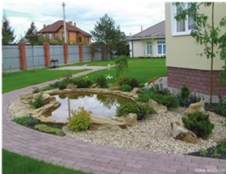
Рис. 6. Ландшафтный дизайн

В последнее время наряду с традиционными понятиями «садово-парковое искусство» и «ландшафтная архитектура» все чаще употребляется понятие «ландшафтный дизайн» (рис. 6) – когда речь идет о небольших благоустроенных зеленых уголках, как правило, в высокоурбанизированной среде пешеходных улиц и городских центров; а также «фитодизайн» – как искусство составления зеленой композиции букета, миниатюрного сада или зеленого уголка в интерьере.