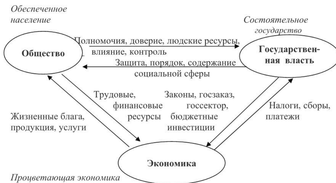
Рис. 2. Взаимодействие в триаде общество – экономика – государственная власть

Общество обеспечивает экономику трудовыми и финансовыми ресурсами. В ответ получает жизненные блага: финансовые средства, продукцию и услуги для потребления в соответствии со спросом.