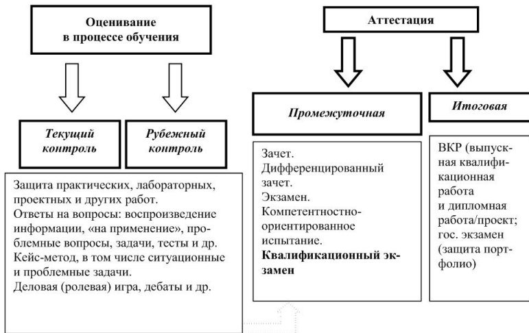
Рис. 1. Традиционные типы контроля в вузе

Текущий контроль – это форма оценивания образовательных результатов обучающихся, представляющая собой оценивание усвоенного учебного материала. Данный вид контроля регулярно осуществляется на протяжении всего периода обучения. Его достоинствами являются систематичность, корреляция с запланированными образовательными результатами, а также возможность оценки уровня сформированности отдельных компонент образовательных результатов обучающегося. В качестве существенного недостатка данного типа контроля выступает его фрагментарность и локальность проверки. Комплексную, целостную оценку образовательного результата, а не отдельных ее компонент (ЗУН)