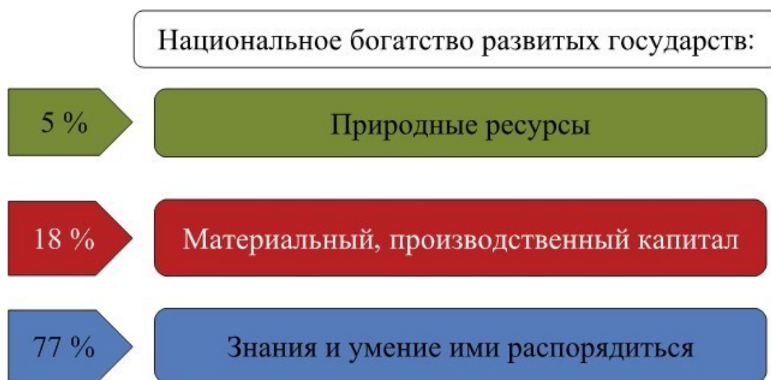
Рис. 1. Оценка Всемирного банка ресурсов развитых государств

Современное общество развивается в шестом технологическом укладе, ценностью которого является использование всех технических достижений для максимально персонифицированных задач. Поэтому само общество часто называют Smart общество – умное общество (разумное). В том числе это относится и к образованию (рис. 1).