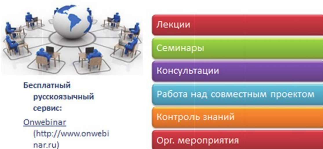
Рис. 3. Интеллектуальный электронный ресурс

Фактически создается новая среда для обучения человека в течение всей жизни по его актуальным образовательным запросам и потребностям.