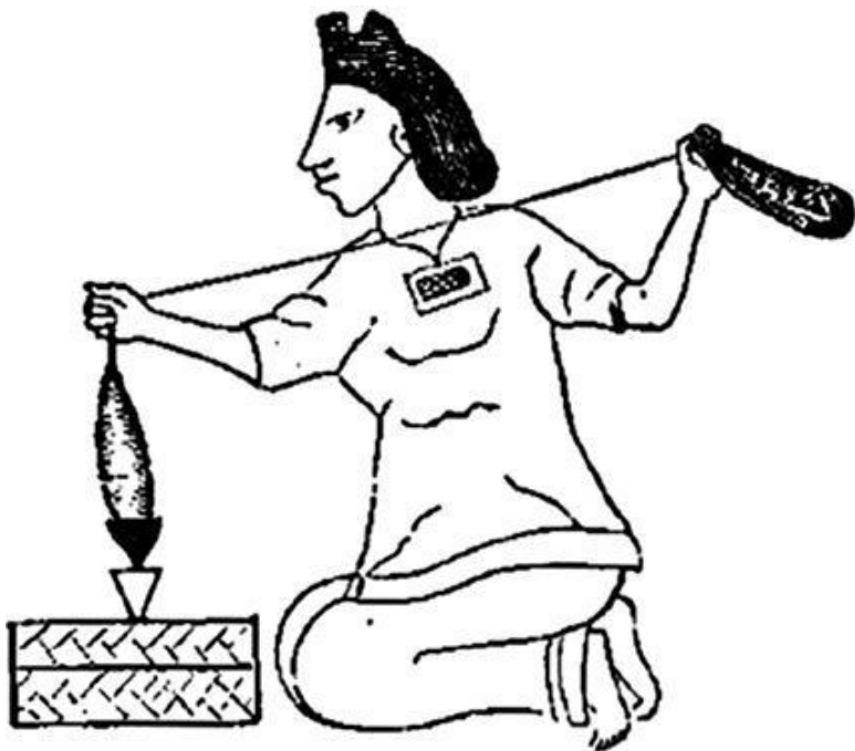
Ацтекская женщина за прядением

500 лет назад в дюжине мелких деревень на побережье Тихого океана, там, где сегодня находится Мексика, люди про-