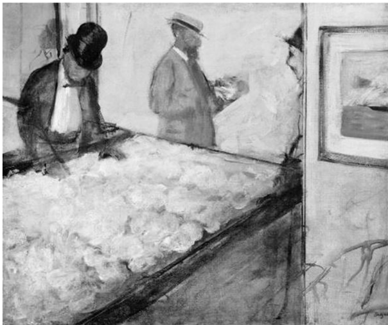
Торговцы хлопком в Новом Орлеане, 1873 год.

В конце января 1860 года члены Манчестерской торговой палаты собрались в городской ратуше на свою ежегодную встречу. Среди шестидесяти восьми человек, собравшихся