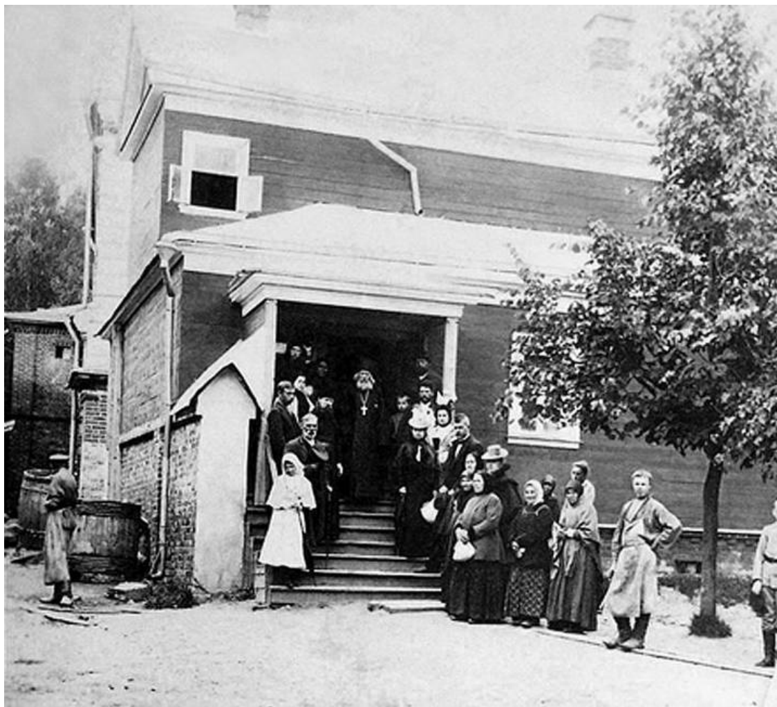
Паломники у отца Варнавы.

Для тех, кто воистину возлюбил Бога и возжаждал горнего уже на земле, великий гефсиманский старец составил правила, которые помогают подвижникам устоять в добродетели и, по возможности, избегать греха. В этих правилах он обобщил способы и средства, рекомендуемые опытными в христианской жизни и достигшими величайшей степени христианского совершенства мужами: