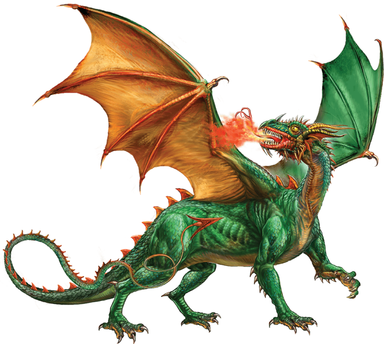
Крылатый дракон, извергающий пламя