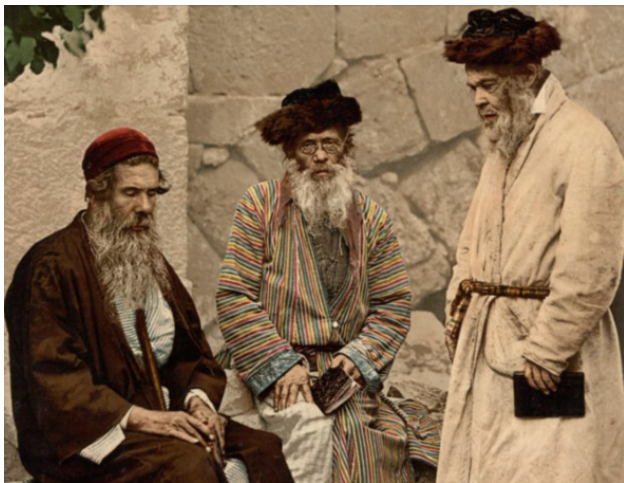
Фото из источника в списке литературы [16]

В идише принято выделение ряда диалектов, распределя-