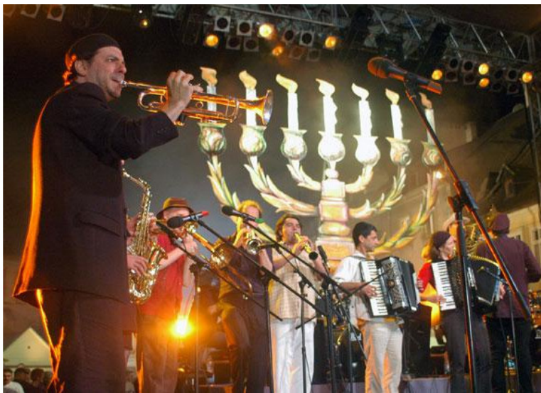
Фото из источника в списке литературы [17]