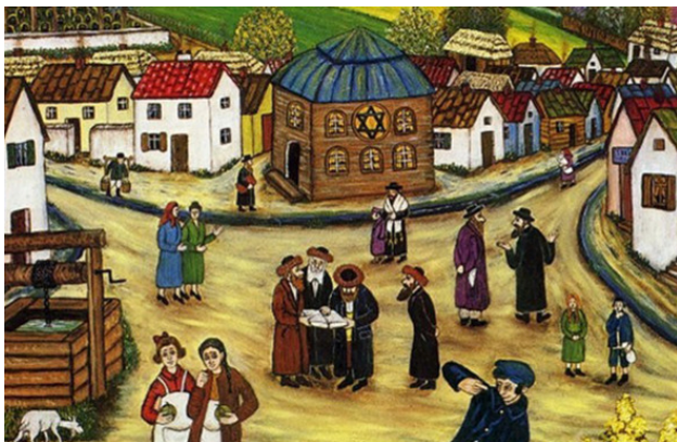
Фото из источника в списке литературы [15]