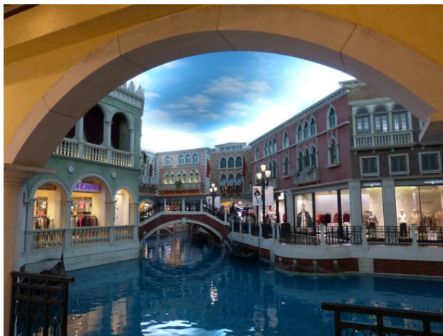
Венецианский стиль Макао

Макао – это единственное место в Китае, где азартные игры разрешены официально. Здесь находится около тридцати казино. Большинство из них расположено на полуострове Макао, а другая часть строений расположена на перешейке Котай и острове Тайпа.