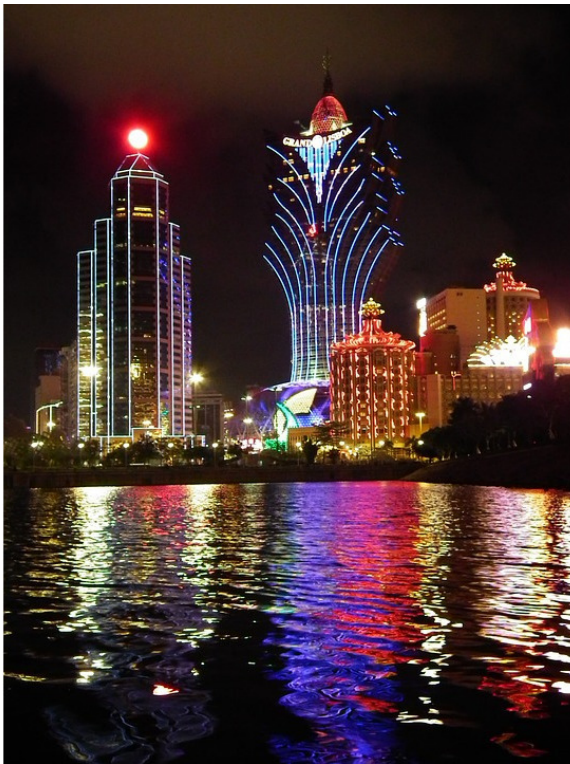
Очаровательный пейзаж ночного Макао