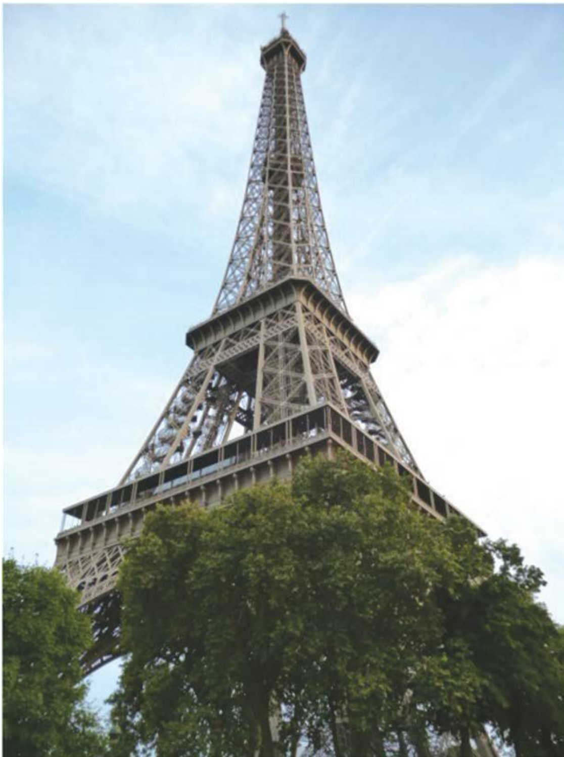
Эйфелева башня в Париже.

Журнал «Forbes» в 1985 году писал: «Экономический провал американской ядерной энергетической программы является крупнейшей управленческой катастрофой в истории бизнеса. Индустрия коммунальных услуг уже инвестировала в нее 125 млрд долл. США, но до конца десятилетия требуется еще 140 млрд. Теперь только слепые или предвзятые люди могут думать, что эти деньги не потрачены впустую».