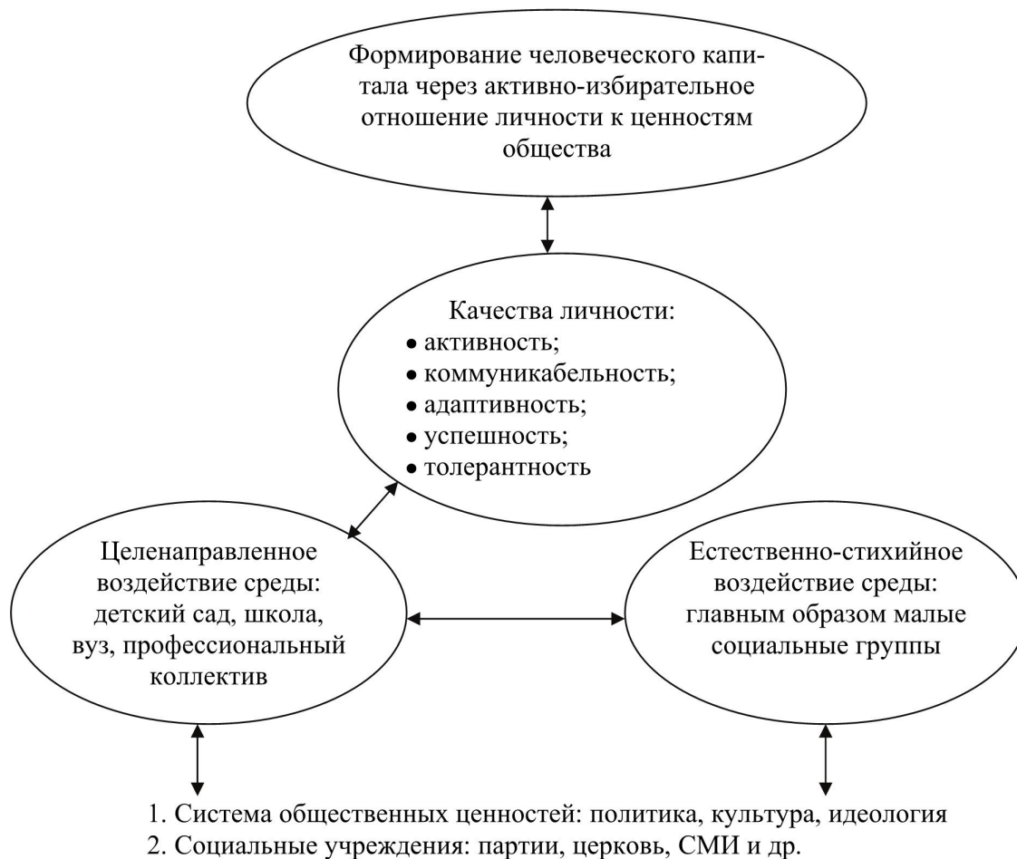
Рис. 2. Модель процесса формирования человеческого капитала

Предлагаемая модель является продолжением предыдущих разработок по социально-психологическим аспектам процесса социализации личности, сущность которого состоит во взаимодействии факторов детерминации успешности и индивидуально-личностной мотивации к успеху.