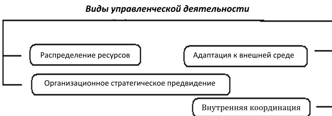
Рис. 1.1. Основные виды управленческой деятельности

Стратегия как детальный комплексный план предназначена для обеспечения осуществления миссии организации и достижения ее целей.