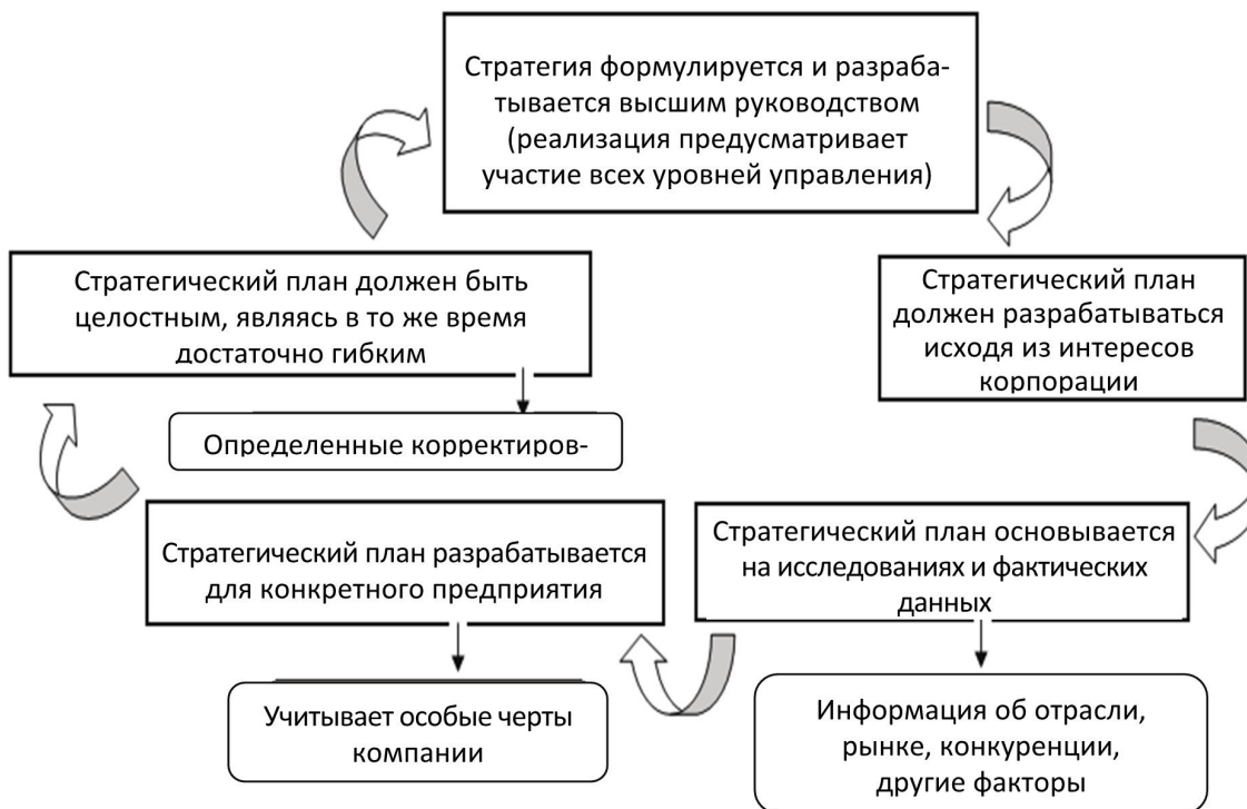
Рис. 1.2. Основные характеристики стратегии

Стратегическое планирование как таковое дает основу для принятия решения. Правильная конкретизированная постановка целей организации обеспечивает реалистичные способы и методы их достижения. Принимая обоснованные и систематизированные плановые решения, руководство снижает риск принятия неправильного решения.