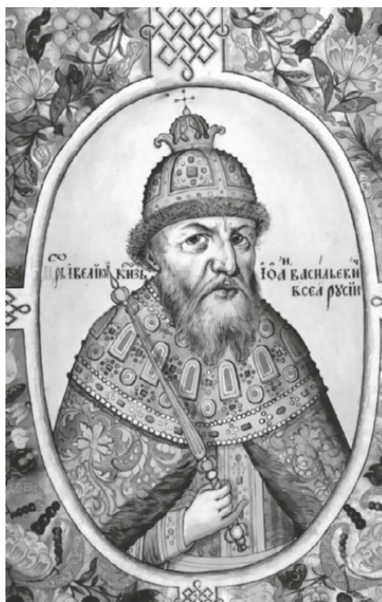
Царь Иван Грозный

Мы привыкли считать, что Сибирь – неотделимая часть нашей страны, и не представляем Россию без нее. Это почти как человек без половины туловища. А ведь когда-то Сибирь не была нашей землей. Более 600 лет назад на ее просторах обитали рассеянные кочевые племена – угров (или югров) на севере, остяков и вогулов (нынче это ханты и манси) на юго-западе. В XIII веке Южную Сибирь захватили монголо-татары, и часть ее территории вошла в Золотую Орду. Позднее там образовалось Сибирское ханство. Столицей ханства был город Сибирь, располагавшийся недалеко от нынешнего Тобольска.