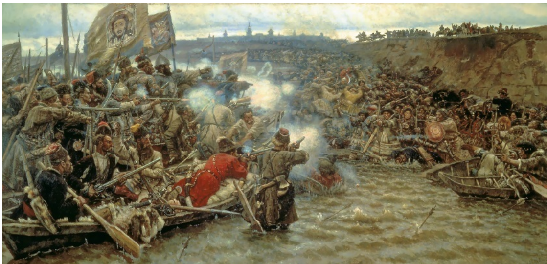
Покорение Сибири Ермаком

Положение русских в Сибири было неустойчивым. Свободолюбивые племена угров нередко восставали против новгородцев. Чтобы обуздать их, в 1460–1490-х годах при великом князе московском Иване III Васильевиче совершались военные походы против угров и вогулов – до рек Тобола и Оби. Татары же то сами просили русского царя взять их «в свою волю и под свою руку», то бунтовали и отказывались платить дань. Хан Кучум, например, не только вышел из-под власти Москвы, но и подчинил себе угров, остяков и вогулов, бывших данниками Москвы.