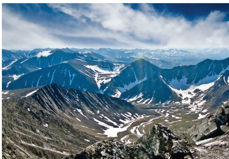
Урал. Хребты западного склона

Пролетая над Западной Сибирью, человек с воображением невольно представит себя там, внизу. Представит в виде точки среди этой бескрайней озерно-болотно-лесной плоскости и подумает смятенно: как, куда бы я шел, чтобы выбраться оттуда, как бы я перебирался через эти болота и преодолевал эти, несомненно загроможденные буреломом, леса? И, возможно, решит, что не выберется из этих лесов никогда. И будет недалек от истины. Недаром людей отправляли в ссылку в эти края, не беспокоясь, что они оттуда убегут. Беспредельные просторы тайги служили более надежной преградой, чем толстые стены тюремных острогов.