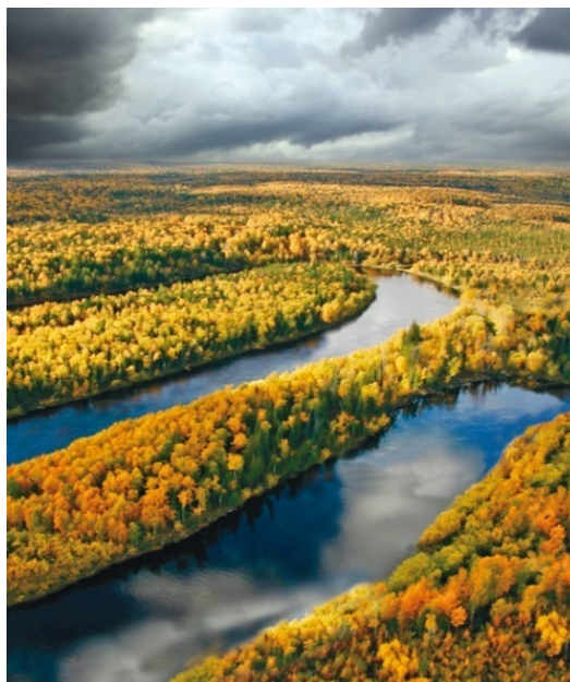
Западная Сибирь с высоты птичьего полета

– болота, а многочисленные круглые «дырки» – озера, покрывающие всю западно-Сибирскую низменность и нередко сливающиеся с болотами. Многие водоемы имеют рыжую кайму, узкую или широкую. Это заболачивающиеся по краям озера.