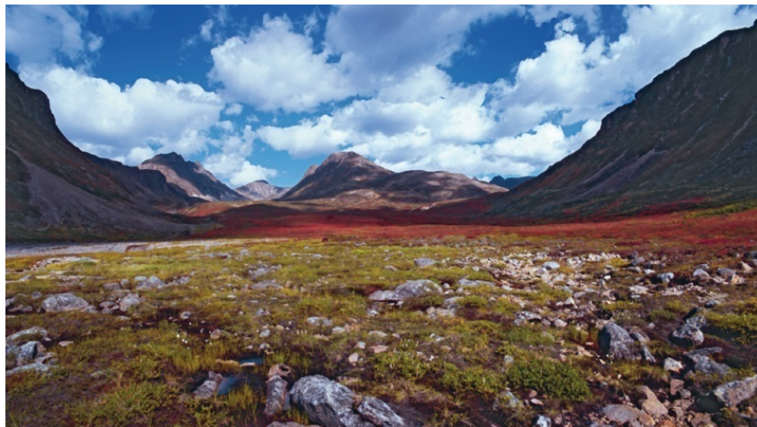
Хребты Восточной Сибири

больше тех круглых блюд-озер и обширных болот, а все больше выются речки, поблескивая путаными нитями, а озера если и встречаются, то чаще – замысловатых, вытянутых форм. Тайга здесь более густая, но и более светлая – лиственничная, сосновая, пихтовая, кедровая. А кое-где торчат непокрытые, каменистые вершины гор.