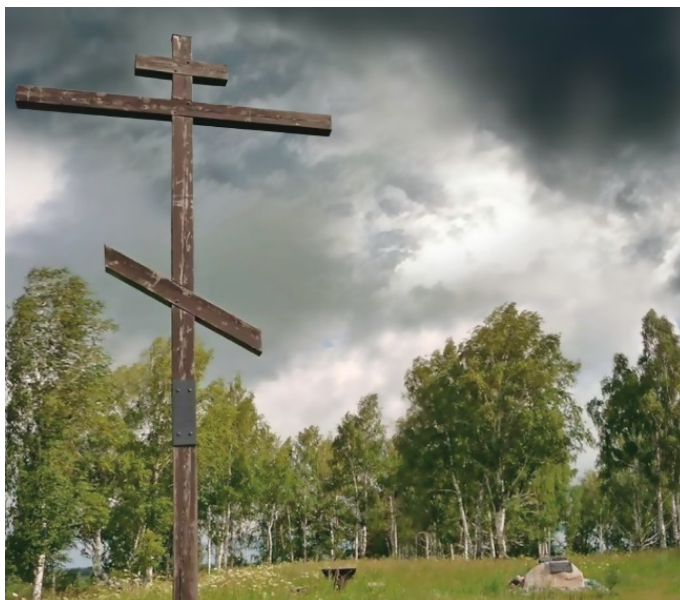
Крест на месте гибели Ермака

Надо понимать, что своими необычайными победами небольшой отряд Ермака, помимо казацких боевых навыков, обязан был огнестрельному оружию, неизвестному в Сибири той поры.