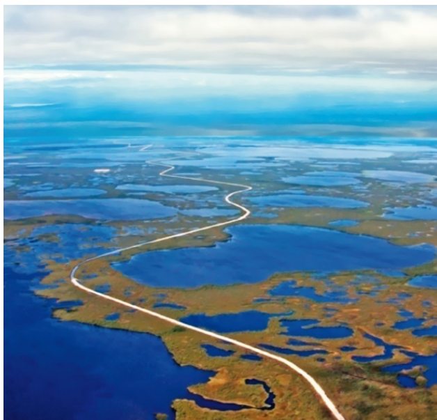
Сибирь. Тюменский край

Чтобы пересечь эту территорию с запада на восток, даже сегодня – на поезде, например – вам понадобится четыре с половиной дня. А в былые (царские) времена путешествие через Сибирь занимало обычно не один месяц. Наш прославленный писатель А. П. Чехов ехал через Сибирь, направляясь на остров Сахалин (в 1890 году), больше двух месяцев. Он плыл сперва на пароходе по Каме, ехал железной дорогой от Перми до Тюмени, затем трясся в тарантасе по Сибирскому тракту, меняя экипажи, увязая в грязи, переправляясь на лодках через разлившиеся реки.