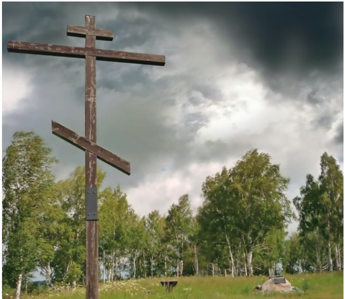
Крест на месте гибели Ермака

Покорив Сибирское царство, Ермак сначала и не думал о подданстве московскому царю. Он уведомил о своих победах пославших его Строгановых, а дань собирал с сибирских жителей в свою пользу. Но скоро выяснилось, что удержать-ся в Сибири с ничтожным количеством оставшихся казаков совершенно невозможно. И тогда Ермак снарядил в Москву к царю ходоков с дарами и просьбой принять покоренное