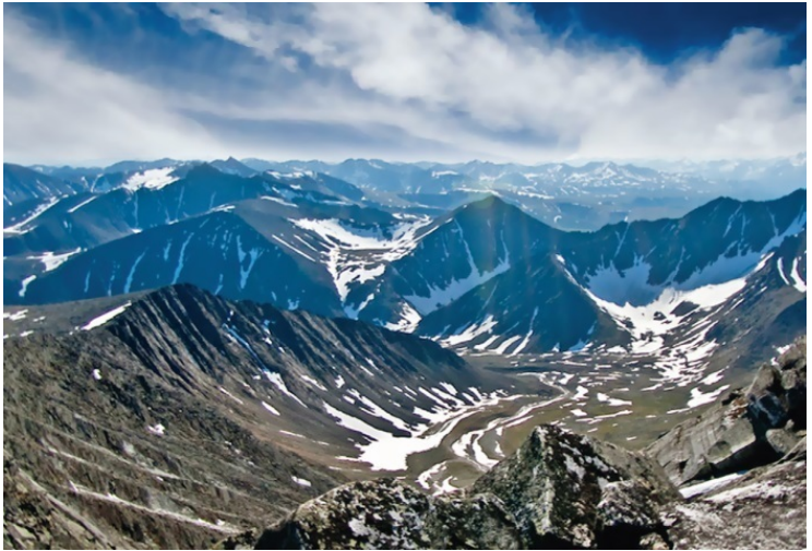
Урал. Хребты западного склона

ляли в ссылку в эти края, не беспокоясь, что они оттуда убегут. Беспредельные просторы тайги служили более надежной преградой, чем толстые стены тюремных острогов.