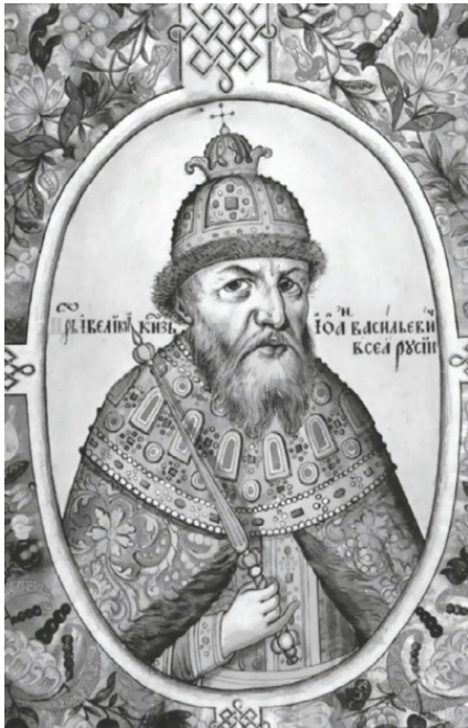
Царь Иван Грозный