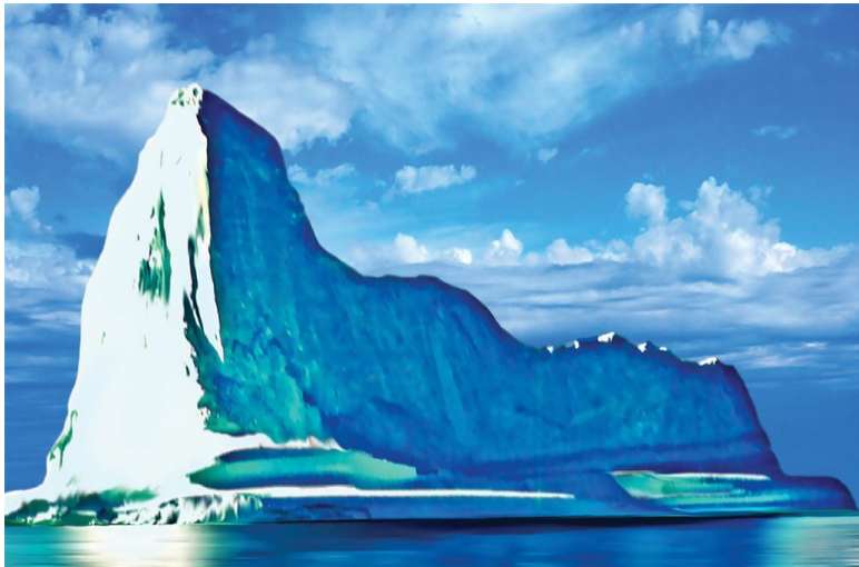
Айсберг в Атлантике