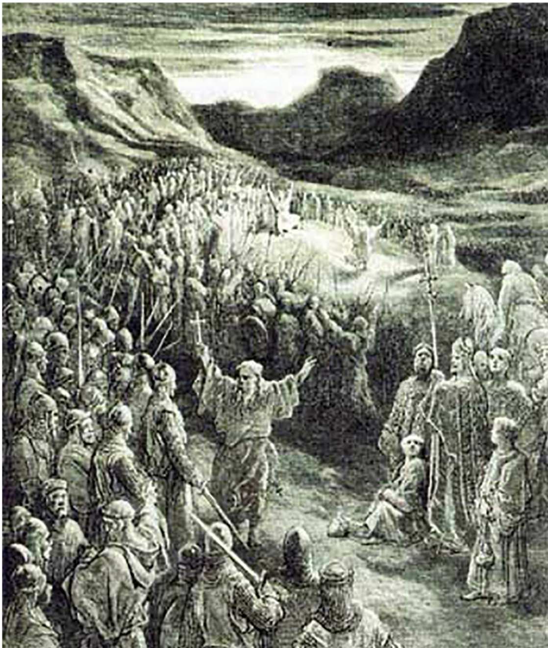
Петр Пустынный призывает христиан к Крестовому походу

Немедленно в Пиаченце был созван собор; тут были и послы от императора Алексея, на которых было возложено представить папе картину бедствий на Востоке. Более двухсот епископов и архиепископов, четырех тысяч духовных лиц и тридцати тысяч лиц светского звания присутствовали на соборе. Но ничего здесь не было решено. Великое решение состоялось на новом соборе, более торжественном и многочисленном, соборе Клермонтском, в Овернии. После многих совещаний о преобразовании духовенства, об установлениях относительно порядка, справедливости и человечности, был поднят вопрос о Св. Земле. Совещание, на котором раздалось слово об Иерусалиме, было десятое по числу на соборе; оно происходило на большой Клермонтской площади, покрытой несметными толпами народа; для папы был воздвигнут престол. Петр Пустынный заговорил первый; голос его дрожал от слез, когда он обратился к народу, и слова его произвели потрясающее впечатление. После него начал говорить папа Урбан, который представил зрелище наследия Христова – в позорном порабо-