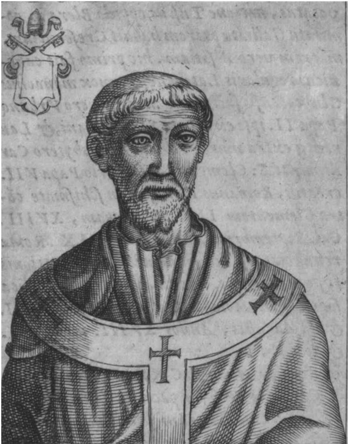
Папа Урбан II

В первые весенние дни 1096 года внезапно и повсеместно разгорелся порыв выступить в поход; ничто более не могло сдерживать благочестивого рвения крестоносцев. Все звания, возрасты и сословия смешались под знаменем Креста. Дороги были усеяны отрядами, из среды которых то тут, то там раздавался возглас: «Бог того хочет!» – и вместе с тем звуки труб и литавр и пение гимнов и псалмов. Целые семьи, забрав с собой провизию, утварь и мебель, пускались в Палестину, предавая себя провидению Того, Кто питает птиц небесных. Деревенские дети, встречая на пути город или замок, спрашивали в своем простодушном неведении: «Не это ли Иерусалим?»