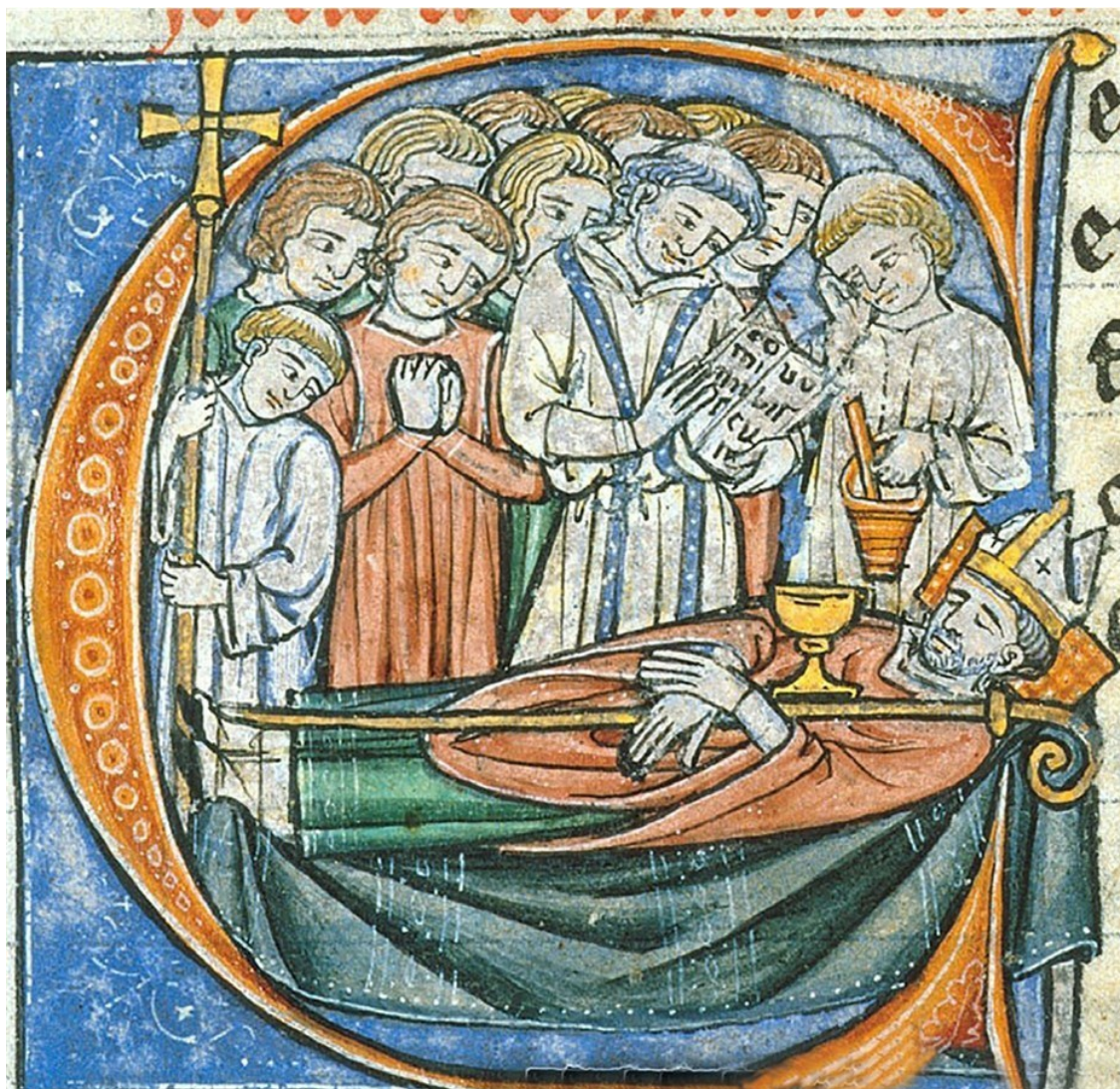
Смерть епископа Адемара