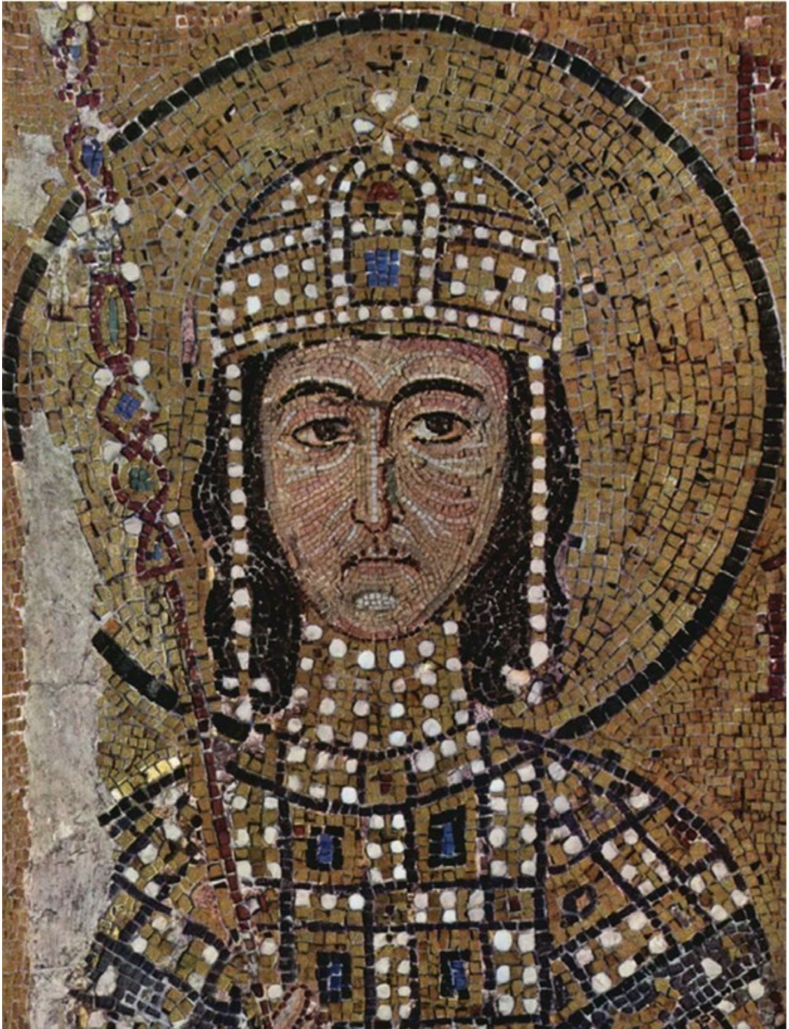
Император Алексей I Комнин

Алексий Комнин искал помощи на Западе в защиту от вторжения мусульман, но по мере того, как князья-крестоносцы подвигались со своими войсками к Константинополю, Алексий начинал опасаться многочисленности своих освободителей. И этому наплыву народов на его владения он противопоставил политику хитрости, коварства и подкупа. Он трепетал на своем ветхом престоле, и в самом деле, если бы не было благочестивого Готтфрида, который не допустил, чтобы нарушена была присяга, принятая перед крестовым походом, то латинские знамена развевались бы уже с тех пор на стенах Византии.