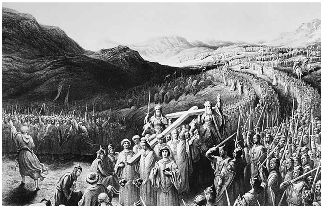
Крестоносцы отправляются в поход