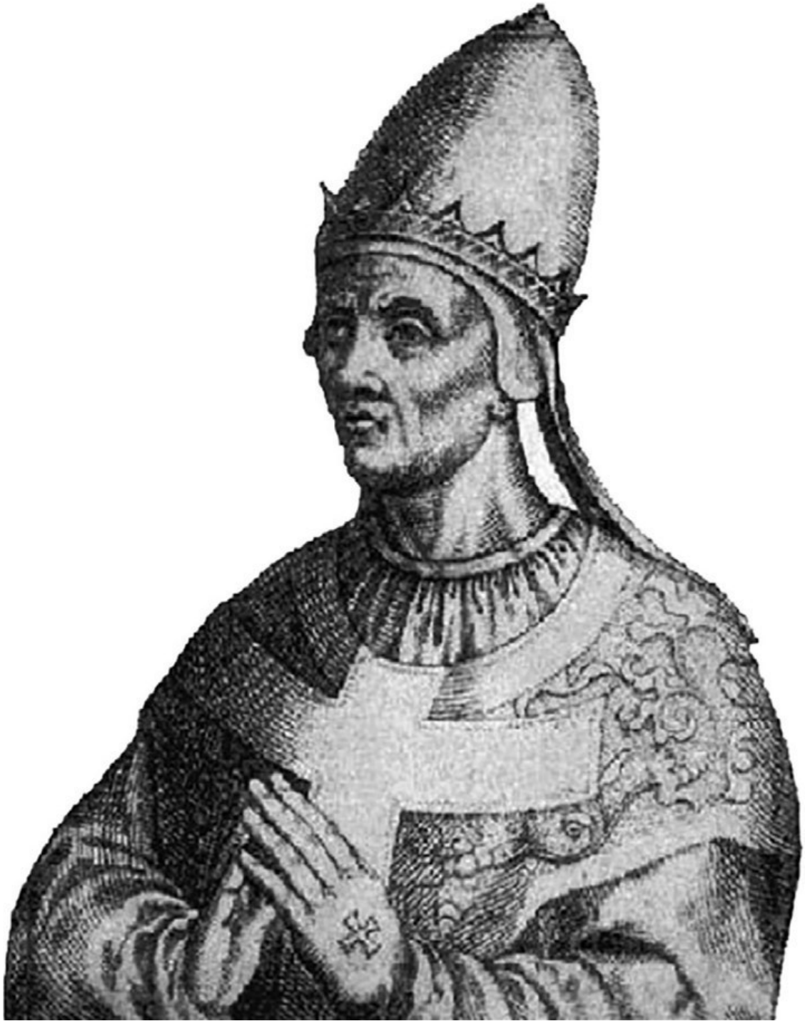
Папа Григорий VII

Вторжение турок, «эта наковальня, которая должна была тяготеть над всей землей», по выражению одного летописца, подчинило Восток новым владыкам, а палестинских христиан – новым притеснителям. К такому громадному количеству врагов, восставших против последователей Евангелия, Европа не отнеслась равнодушно. Папа Григорий VII, человек энергичный и смело-предприимчивый, начал убеждать христиан вооружиться против мусульман; пятьдесят тысяч человек отозвались на его призыв, и Григорий VII сам должен был вести их в Азию. Но он не мог осуществить этого предприятия. Преемник его, Виктор III, обещал отпущение грехов всем, кто выступит на битву с сарацинами, свирепствовавшими по берегам Средиземного моря; флот, снаряженный жителями Пизы, Генуи и других городов Италии, явился у