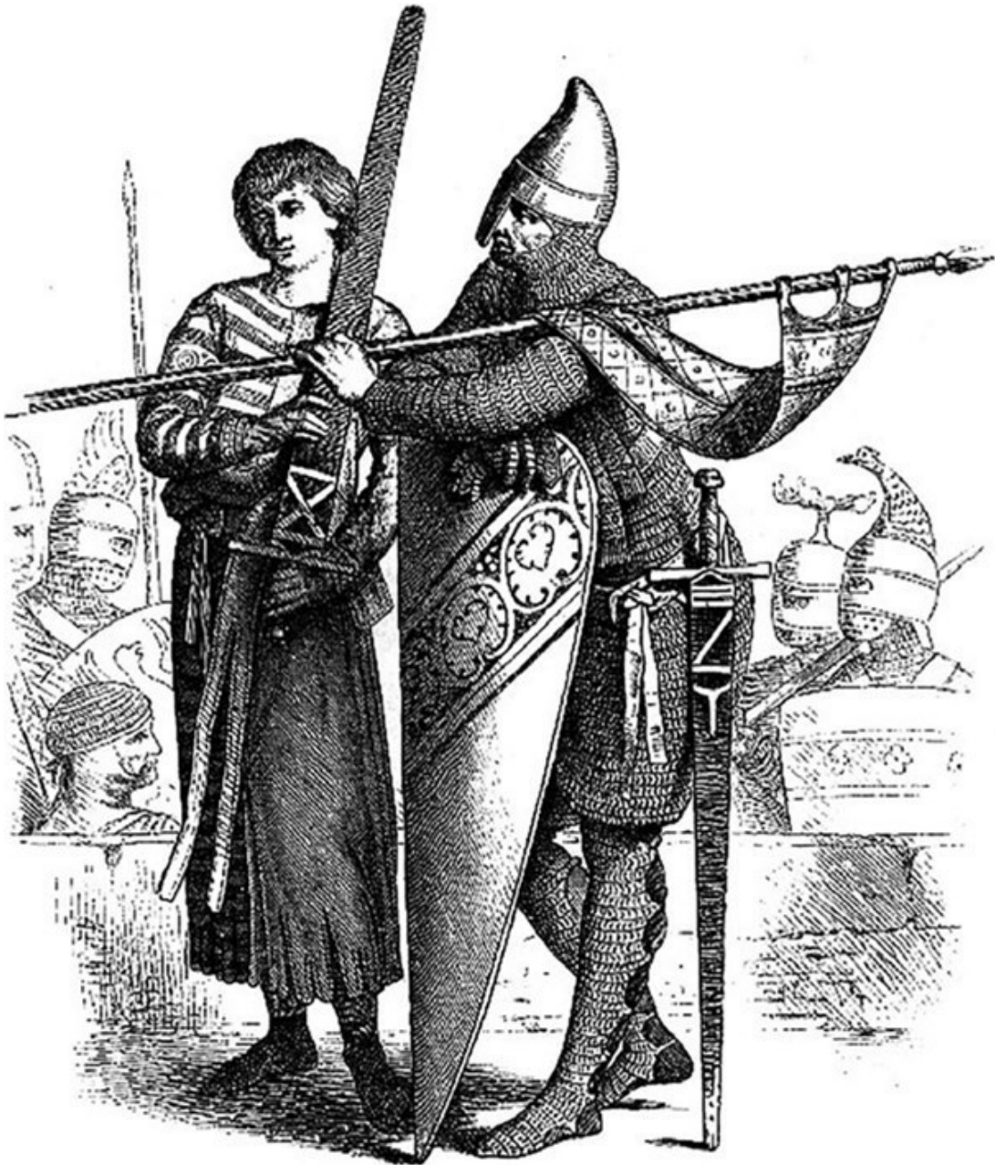
Участники первого Крестового похода

не было ничего, кроме колючего кустарника, хворосту, скал и пропастей; не было дорог, ни даже проторенной тропинки. Эта часть Тавра была свидетельницей великих бедствий и великого отчаяния. Крепость Марезия, изобилующая всякого рода средствами к жизни и население которой состояло из христиан, была в конце этого пути. Жена Бальдуина умерла и была похоронена в этом городе.