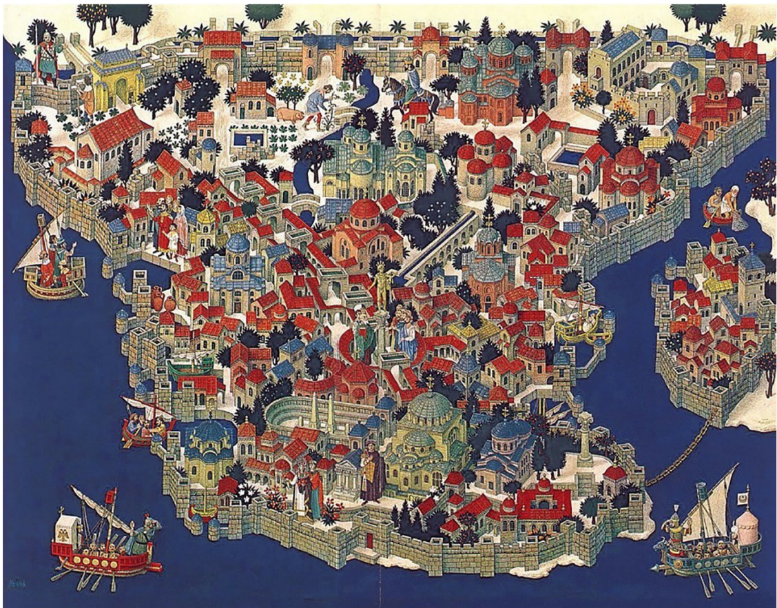
Карта средневекового Константинополя

Тристана, Буаль Шартрский, Гумфрид де Монтегю и знаменитейший из всех – Танкред, рыцарский героизм которого воспели поэты и прославили историки. Адемар Монтейский и Раймонд, граф Сен-Жильский и Тулузский, были избраны вождями крестоносцев из южных провинций. Епископ Адемар, первый принявший крест на Клермонтском соборе, получил от папы Урбана II титул апостольского легата, духовного вождя крестового похода. Митра духовного владыки и рыцарский шлем были попеременным его облачением; он был образцом, опорой и утешителем всех ополчившихся в священный поход. Раймонд Сен-Жильский обагрил свой меч кровью мавров в Испании. В нем уже не было первого пыла молодости, но и в преклонных годах он отличался неустрашимостью и непоколебимой твердостью характера. Он простился со своими обширными и многочисленными владениями на берегах Роны и Дордони и отправился на Восток, в сопровождении знатнейших владетелей из Гасконии, Лангедока, Прованса, Лимузина и Оверни.