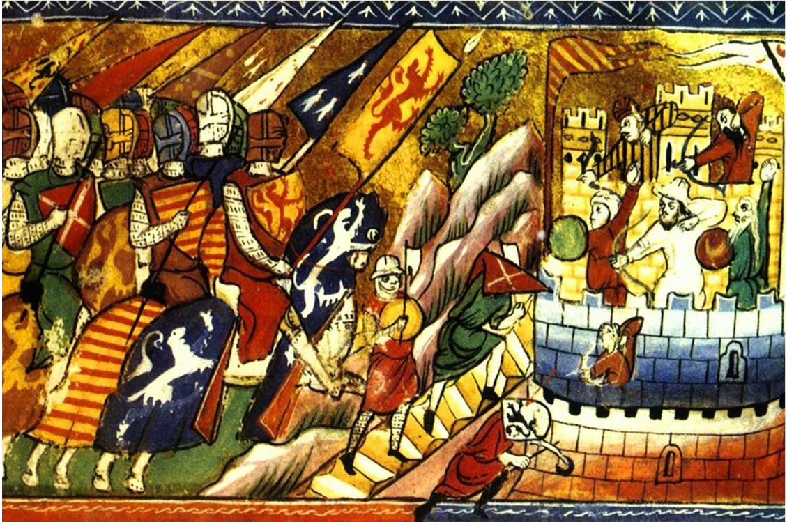
Осада Антиохии. 1-й Крестовый поход

Оставались у осажденных еще одни городские ворота, через которые они могли получать продовольствие и пользоваться свободным движением по левому берегу Оронта; сюда не заходил еще ни один крестоносец: они были с западной стороны и назывались воротами св. Георгия. Вожди рассудили, что необходимо было устроить возможность производить нападения отсюда и пришли к тому заключению, что следовало захватить позицию вокруг этих западных ворот; но это было сопряжено с большой опасностью, и некоторые из предводителей войска отказывались брать на себя такое дело. Тут выступил Танкред, но у знаменитого рыцаря не доставало денежных средств, чтобы осуществить это предприятие; тогда граф Тулузский дал ему сто марок и остальные вожди помогли, каждый по возможности. На холмике, вблизи ворот св. Георгия, возвышался монастырь того же имени; Танкред приказал его укрепить, и, поддерживаемый избранным отрядом воинов, он сумел продержаться на этом важном посту.