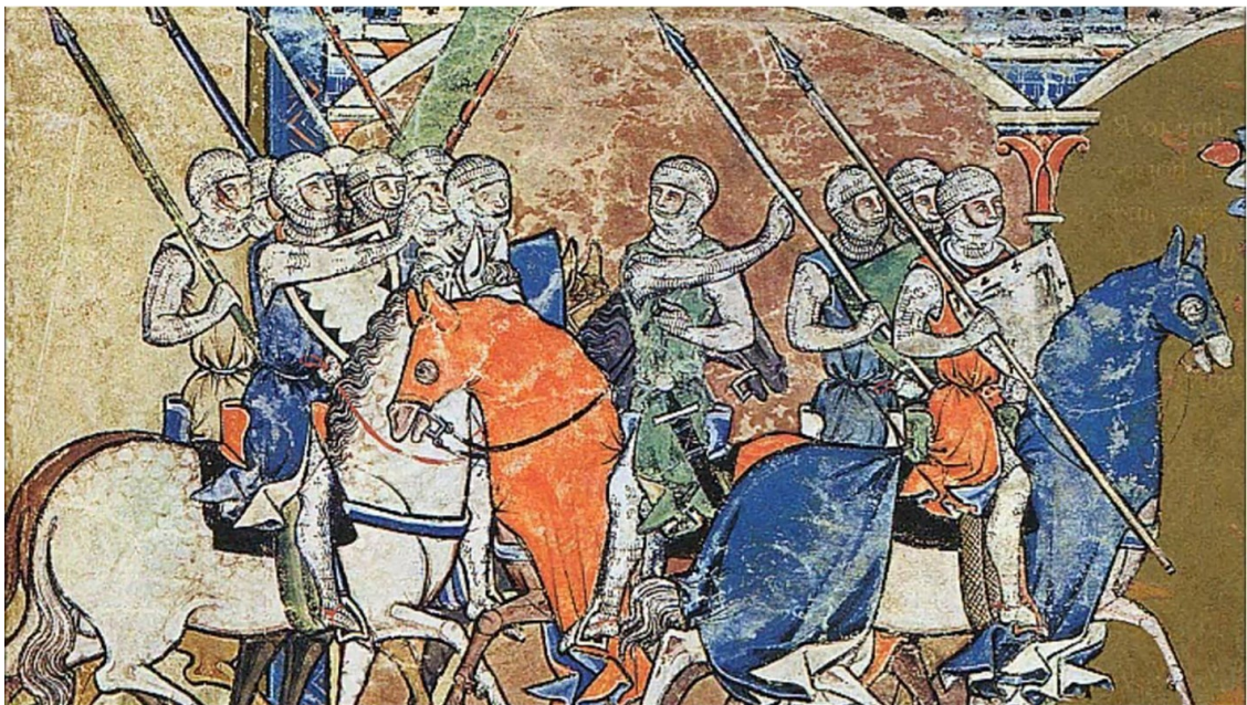
Крестоносцы в походе

Боэмунд делает распоряжение, чтобы были расставлены палатки; мгновенно на берегу реки устраивается лагерь и здесь располагается слабейшая часть войска. Нападение на него было сильное; неприятель имел превосходство численности, перед которой все чудеса храбрости христианских воинов должны были оказаться бесплодными.