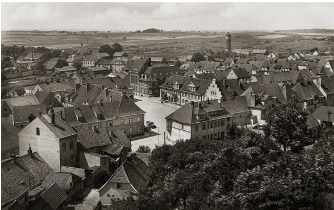
Домнау до войны 1941—1945 гг., фото из архива Домновской модельной библиотеки.

Всю вторую половину XIII века Тевтонский орден планомерно захватывал прусские земли. Военные столкновения чередовались с дипломатическими ходами. Еще в 1249 году с прусскими вождями из Вармии, Наттангии и Помезании был заключен Христбургский договор, состоящий из нескольких пунктов. Орден брал на себя обязательство не выступать против пруссов, принявших веру, и соблюдать их права. Пруссы, принявшие христианство, отказывались от языческих обрядов. Они обязаны были построить 22 католических храма и несколько крепостей. К строительству привлекались и некрещенные пруссы с последующим крещением. Когда же их заставляли трудиться в летнюю страдную пору, это вызывало недовольство и они протестовали.