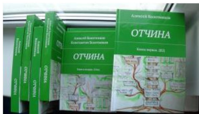
Фото 5. Поступил тираж книги «ОТЧИНА»