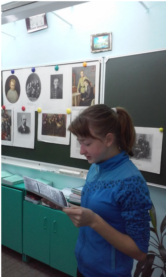
Фото 2. Их путь вспоминали и школьники...

Весть об Октябрьской революции, взятии Зимнего двор-