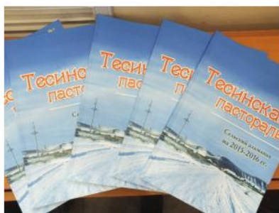
Фото 4. Поступил тираж журнала «Тесинская пасторка»