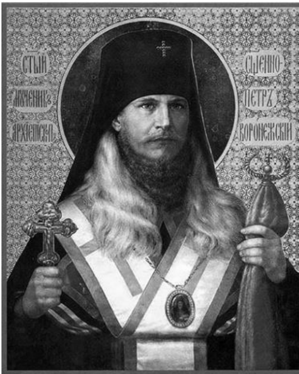
Икона священномученика Петра (Зверева).